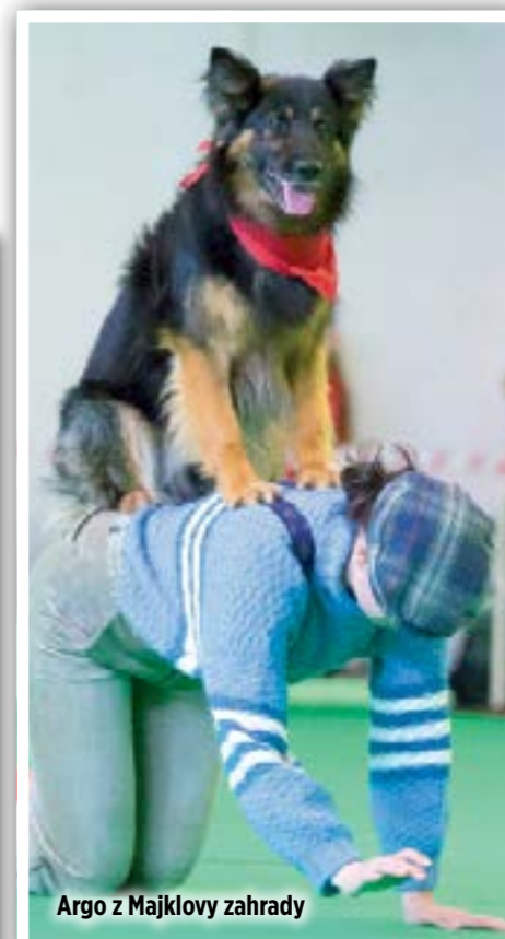
Argo z Majklovy zahrady