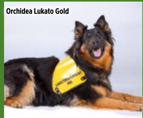
Orchidea Lukato Gold

Zaměstnat psa je asi nutnost u každého plemene, nejde říct: tohle je dobré plemeno do bytu, tohle ale ne. Každé plemeno potřebuje nějakou zábavu, vycházky atd.