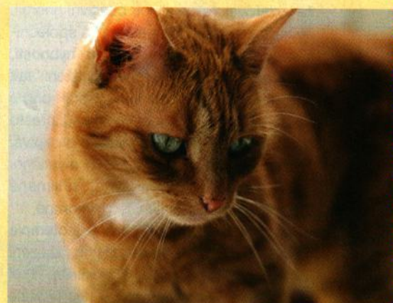
▲ Zrzavá kočka Sára pomáhá při terapiích často a dobrovolně.

Felinoterapie je definována jako psychosociální a rehabilitační metoda podpory zdraví využívající pozitivního působení kontaktu člověka s kočkou. Má buď podobu cílenou, jejíž výsledky jsou objektivně posouditelné, nebo relaxační, jejímž výstupem je zklidnění a navození vyrovnanosti a pohody. Může probíhat formou pasivní terapie, kdy již pouhá přítomnost kočky odbourává pocit samoty, anebo interaktivní, při níž je o zvíře konkrétně pečováno a člověk za ně cítí zodpověd-