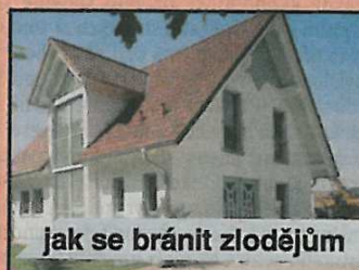
jak se bránit zlodějům