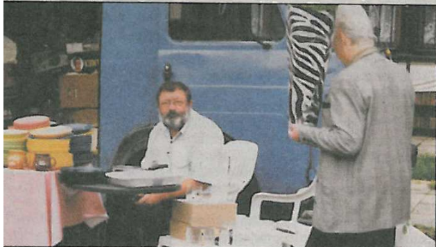
hypermarkety prý končí. Obchod budoucnosti bude velmi různorodý - své místo v něm najde i malý prodejce.