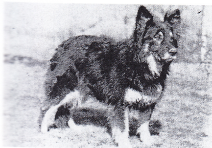
Bessy – zakladatelka chovu chodského psa

a odolné psy se všestrannou upotřebitelností. Výborné hlídače, společníky za každých podmínek – prostě ideální rodinné hlídací psy. Je pozoruhodné a z hlediska počátku chovu chodského