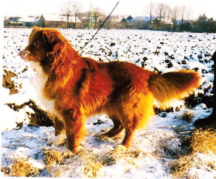
Nova Scotia duck tolling retrív Littlerivers Gypsy King – import Nové Skotsko

První jedince tollerů (NSDTR) jsem importovala z Dánska a roli v tom sehrál právě chodák. Z Dánska mě kontaktovala zájemkyně o štěňata CHP a byla majitelkou výcvikové školy pro psy. Na jejích prezentacích a videích jsem vi-