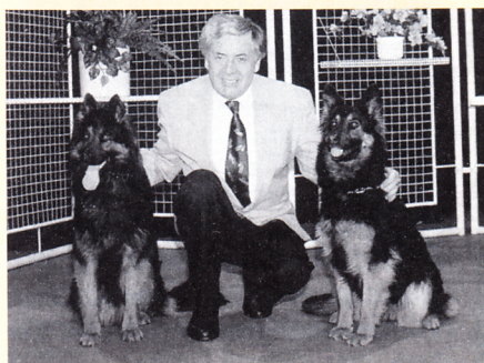
Prezentovali jsme chodské psy v pořadu Receptář.

Co se týče onoho „měkkého“ psa – protože mám něco společného i s všestranným výcvikem psů, jsem si vědoma i občasného takového názoru některých zkušených výcvikářů. Ano, jde-li o ZKO, kde jsou většinou plemena jako NO, belgický ovčák, rotvajler... Tak tato plemena při nácvicích jsou ve věku několika měsíců většinou jiná, než je chodský pes. CHP nemá tak vyvinutou „zlobu“ při obranách. Při nácvicích zpočátku přistupuje k zákusům spíše formou hry než kořistnického pudu či podmíněně vyprovokované zloby. Rozhodně si u chodáka figurant „nepomůže“ např. zataháním psa za chlupy, stresovým nuceným kontaktem ve snaze o útok psa z nejistoty či strachu. To by mohl být na hodně dlouho s nácvikem obran u CHP konec. Chodák potřebuje opravdu