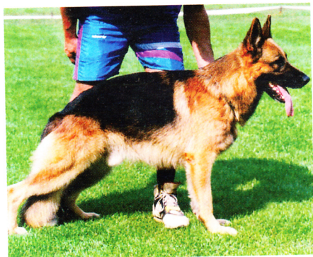
Německý ovčák Necko vom Haus Beck, HD neg., výborný, OV, ZVV1, IPO2, SchH2, ZPO1

Mnozí – spíše tedy už pamětníci – vědí, že moje kynologická éra začínala výcvikem německých ovčáků. V prvních letech jsem měla pouze psy, a ne feny. Až roku 1989 jsem si jela pro svou první fenu německého ovčáka Astu z Bělokoštěl, potom následovali ale opět psi, např. v 90. letech celkem známý Necko vom Haus Beck