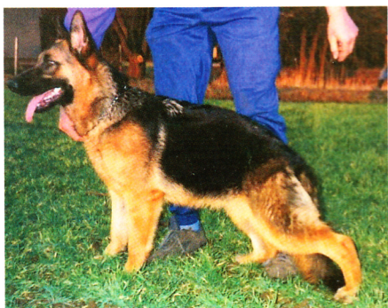
Německý ovčák Collie Bryvilsár

Téměř všechna očekávání se mi splnila. Mám ovčácké plemeno se schopností výcviku, na-prosto bezproblémové ve větší smečce, nebyl problém jet na víkend a mít s sebou pět psů na-