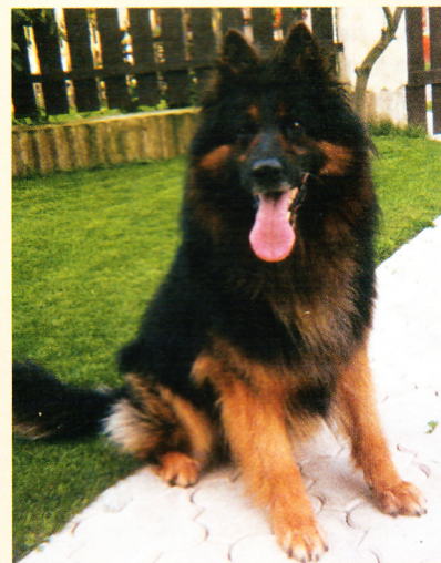
Birri Chodský pes v 7 letech, Šamp., středovýchodoevropský vítěz, 4x klubový vítěz, klubový šampion, 22x BOB, OV, KV. Žil s námi 15 let a nikdy na něj nezapomenu.