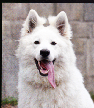
Bílý švýcarský ovčák