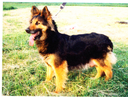
Bessy na Barance, rok 1989

Od prvního vrhu v roce 1985 do konce roku 1990 se narodilo celkem 90 štěňat z 16 vrhů. Ani jednou se neobjevilo nestandardní zbarvení, atypický výraz, krátká srst, poloklopené ucho, nežádoucí povahové projevy, zdravotní problé-