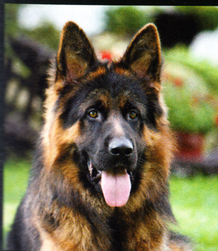
Dlouhosrstý německý ovčák