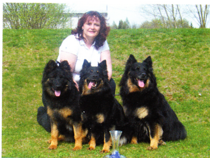
Cora Dolský mlýn, Arri Anne, Cheopsus Regenia Bohemia s chovatelkou

Vzhledem k tomu, že máme pouze jeden vrh ročně, vybíráme zájemce opravdu pečlivě. Osobní