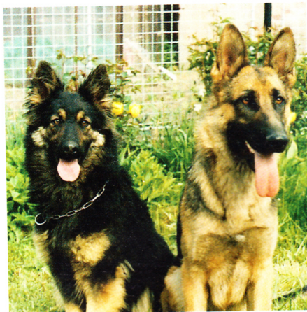
Zakladatelky naší chovatelské stanice – chodský pes Bela na Bylinkách (šampion ČSFR, 2x klub. vítěz, vítěz SV, složené zkoušky ZM, IPO1) a fena německého ovčáka Asta z Bělokoštěl (výb., ZM, ZVV1, IPO2)

štěňat vhodných pro právě „ty své“ nové majitele. A hlavně mě to baví!