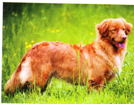
Nova Scotia duck tolling retrív Anafrid Toller Bryvilsár

děla tollery a velmi mě toto plemeno zaujalo. Středáček pes, velmi sytá rezavá barva, retrív, a hlavně pohyblivý, mrštný „sportovec“ – a na to já „slyším“. Sháněla jsem informace, později kontakt na opravdu kvalitní chovatele tohoto plemene a jela jsem pro psa. O feně jsem neuvažovala, přiznám se, že jsem chtěla v počátku „jen“ poznat, jaký toller je zejména