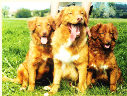
Nova Scotia duck tolling retrívr Happy Hunter a Hurry Helper a Buller