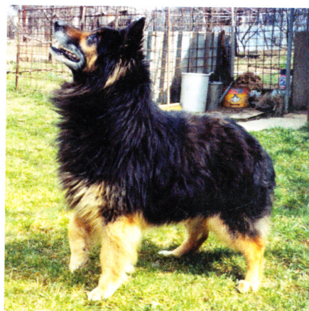
Asan na Bylinkách, rok 1989