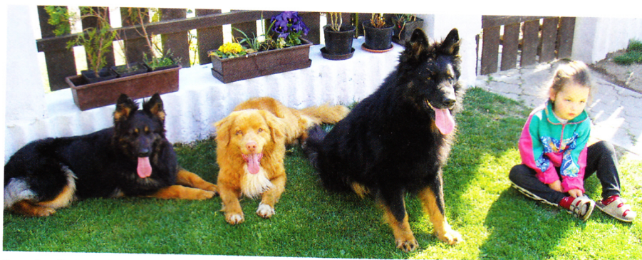
Po náročné vycházce

Srovnatelných je u chodského psa a NSDR pár věcí. Například jejich váha, výška (CHP cca o 2 cm větší), inteligence a zájem o spolupráci s člověkem, přizpůsobivost, rád cestuje, je nekonfliktní, přátelský... I tollery lze mít ve více jedincích pohromadě, stejné jsou i motivace na aporty-míčky. NSDTR je retrív, tedy vodní přinašeč, ale velmi dobře se uplatní také v kynologických sportech. Moc mi také vyhovoval fakt, že obě plemena rychle přecházela z klidu do aktivity. Strhující je jejich nadšení pro práci. Rozdílů je také několik. Toller je trochu tvrdohlavější, majetnický (ať se jedná o hračky či jídlo), má hebcí srst, která nelíná jen sezonně, je větší lovec. A když se toller vzruší nebo je nedočkavý, vydává zvláštní zvuky – jakési skřeky nebo pískot.