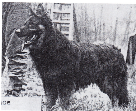
Car na Barance

psa velmi důležité, že všech 12 jedinců narozených z prvních dvou vrhů (a následně i další) odpovídalo požadavkům na regeneraci chodského psa. Všichni měli požadované zbarvení black and tan, tedy černé se znaky. Ideální bylo i ustálení požadované kohoutkové výšky 50-56 cm a hmotnost 16-25 kg. Již tato skutečnost svědčí o tom, že mezi blízkými předky zakladatelů chovu dnešního chodského psa nebyli čistokrevní jedinci německého ovčáka ani jiného již uznaného plemene. Nebylo by to možné z hlediska zákonů dědičnosti – genetiky. Nabízí se fakt, že chov chodského psa započal na jedincích, kteří byli ustálení z důvodu dřívější reprodukční izolace. Naštěstí pro českou kynologii byli ustálení v požadovaných plemenných znacích prokazujících odlišnost od ostatních uznaných plemen.