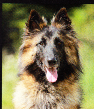
Belgický ovčák tervueren