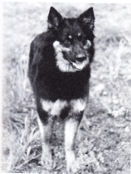
Asta na Barance

Pro oživení krve byli do chovu zařazeni další jedinci, kteří opět museli splňovat výše uvedená kritéria. V roce 1991 to byl pes Brix (zakladatel III. linie), v r. 1996 Alex (IV. linie) a v r. 1996 Harry