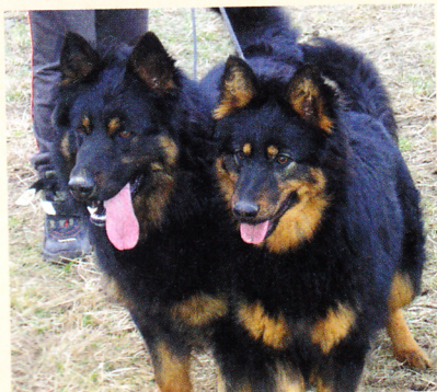
Scuby Swen a Unika Meg Bryvilsár

(syn světového vítěze, který měl mimo jiné složených i hodně zkoušek z výkonu, vč. IPO2, SchH2, obranářských speciálek). Chov jsem neplánovala, aktivně jsem se zabývala všestranným výcvikem, složila jsem se svými psy více než 25 zkoušek z výkonu. Chovatelkou jsem se stala postupem let. Mám pro chov psů dobré podmínky, podporu v rodině, trůfám si říci, že i „cit“ pro výběr chovných párů, vytipování