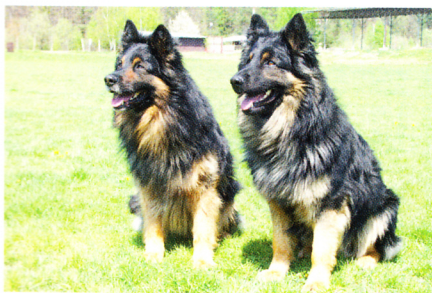
Brix Barracuda Aces a Drago Gold Nova

Brix měl nejraději poslušnost, ale i obranu si užíval. U Draga jednoznačně vyhrály stopy. Argase baví všechno, hlavně když je nějaká čin-