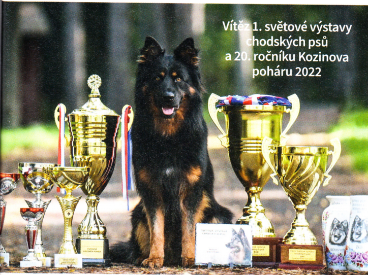
Vítěz 1. světové výstavy chodských psů a 20. ročníku Kozinova poháru 2022

Druhý těžko uvěřitelný zážitek jsme měli na začátku prosince, kdy se v Brně konala Jubilejní národní výstava psů „30“. Tam jsme se po vítězství v plemeni dostali do závěrečných soutěží.