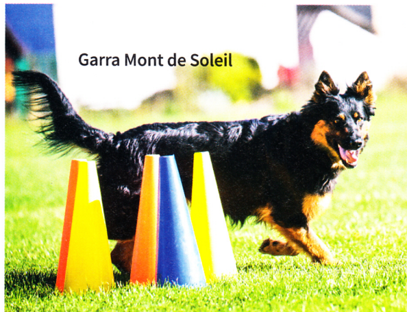
Garra Mont de Soleil