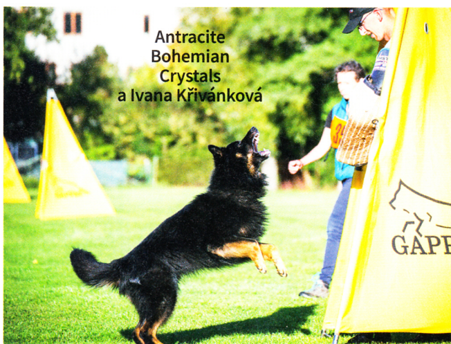
Antracite Bohemian Crystals a Ivana Křivánková

Kromě toho, že při cvičích poslušnosti hltá svého pána pohledem a je ochoten pro něho udělat první, poslední, chodský pes vyniká naprosto skvělým čichem, který při zá-