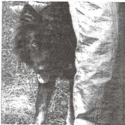
Pes Darenn Garsia, kterého vážně zranil neznámý střelec, se schovává za svoji majitelku.

Poté, co se ozval výstřel, vyběhl z vedlejšího hospodářského objektu i soused a pachatele se pokusil stíhat. Paní Milostná si vybavuje, že střelec měl na sobě zelenou bundoškou. Událost oznámila na obvodní oddělení policie v Třebíči, jejím přístupem je však překvapena. „Ten, co se mnou sepišoval protokol, po-