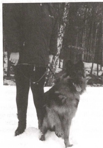
Arno ze Bžan

Aika Dar minulosti (velice živá a temperamentní fenka) Alf Prima Daja (choval se velice důstojně) Argo Lifavo (malá „živelná pohroma, ale pro paničku by „dýchal“) Art Stamo Bud (věrný a tichý „stín“ svého pánička) Baronesa z Aglobern (dáma již ve věku, která se stále „divila“ jak to, že se ještě nejede domů) Cariedaw Lukato Gold (po domácíku šeredka, ale rozhodně krasavice) Carnerro Lukato Gold (dokázal paničce, že „umí“ i mimo cvičák) Cerea Vigilo (dorostenka, která okamžitě „zapadla“ do kolektivu) Dourback Lukato Gold (rozhodně tohoto „mladíka“ nikdo nepřeslechl) Edgar Cidabro (přijel se jen podívat, a určitě nelitoval) Hesi Bryvilsár (snad všem pejskům ukázala svoje břicho) Xaron Bryvilsár (domácky Lomikar, velmi vychovaný fešák) Bišonek Andy (první den všem „vynadal“) Kříženeček Sára (miloučká fenečka) Německý ovčák Dasty (chodáci se mu líbí a rád s nimi soutěžil) Tervueren Veron Rudolfovska skála (alias Monty, moc se mu líbí chodácké slečny) Malinois Baron od Klapského potoka (alias Rudy, s klidem odpočíval pod stolem)