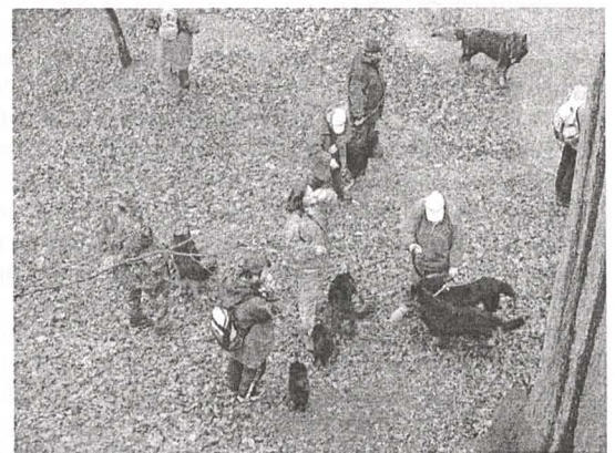
Lomikarova smečka s páníčky