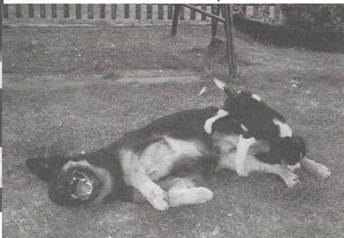
"smějící se" Clea Daraskár