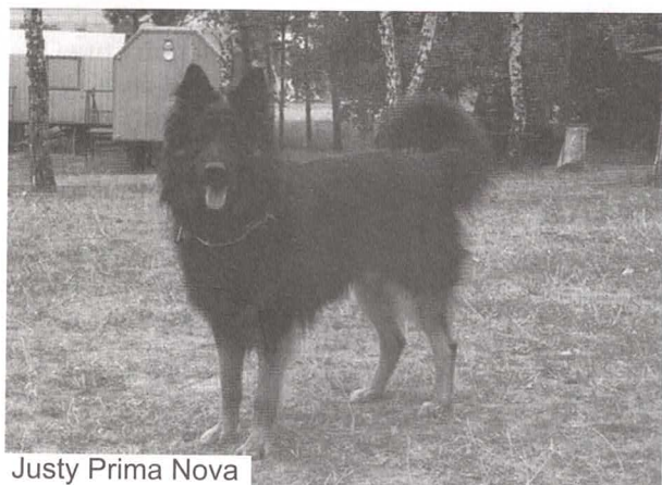
Justy Prima Nova

Každý, kdo přihlašuje svého psa na svod, bonitaci - stejně tak jako na výstavu, zkoušky z výkonu apod. - musí počítat s tím, že kynologické akce mohou trvat, dle počtu účastníků, do pozdějších odpoledních hodin. Vždyť na zkouškách majitel musí také čekat až na vyhodnocení zkoušek, na výstavě máte ve všech propozicích, že majitelé vítězných psů jsou povinni zúčastnit se závěrečných soutěží apod. Každý pes absolvuje svod i bonitaci jednou za život. Proto by si měl jeho majitel vždy udělat dostatek času na absolvování svodu či bonitace.