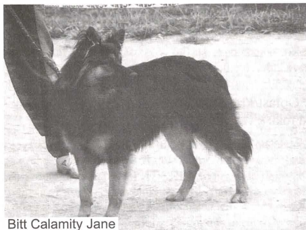
Bitt Calamity Jane