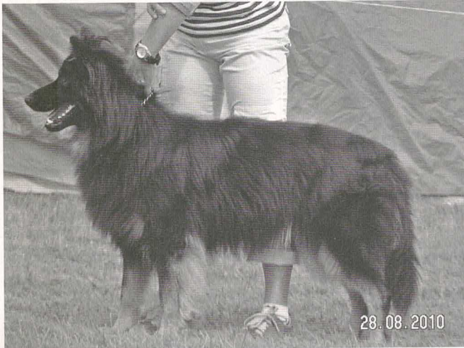
Daemon Vita canina