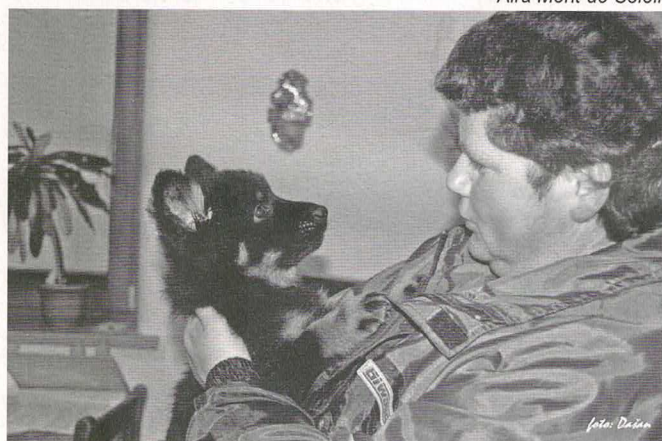
Ubree z Dašického zátíší