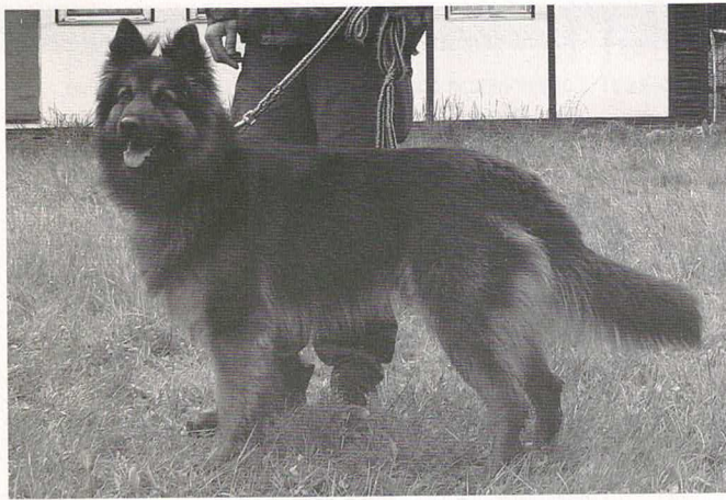
Aron Ronovský poklad