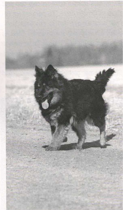
Kesie z Dašického