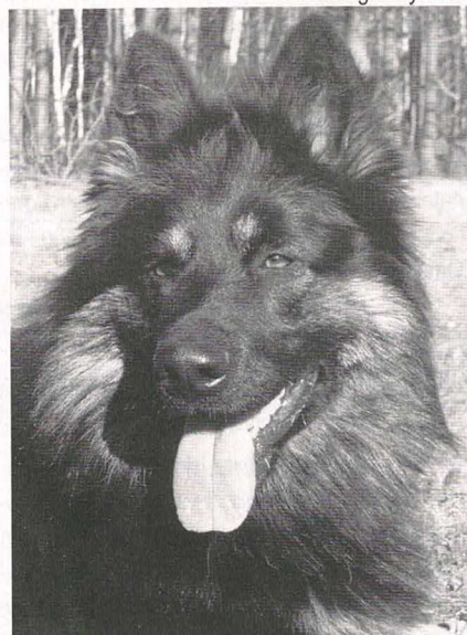
Bady Acacia Hill