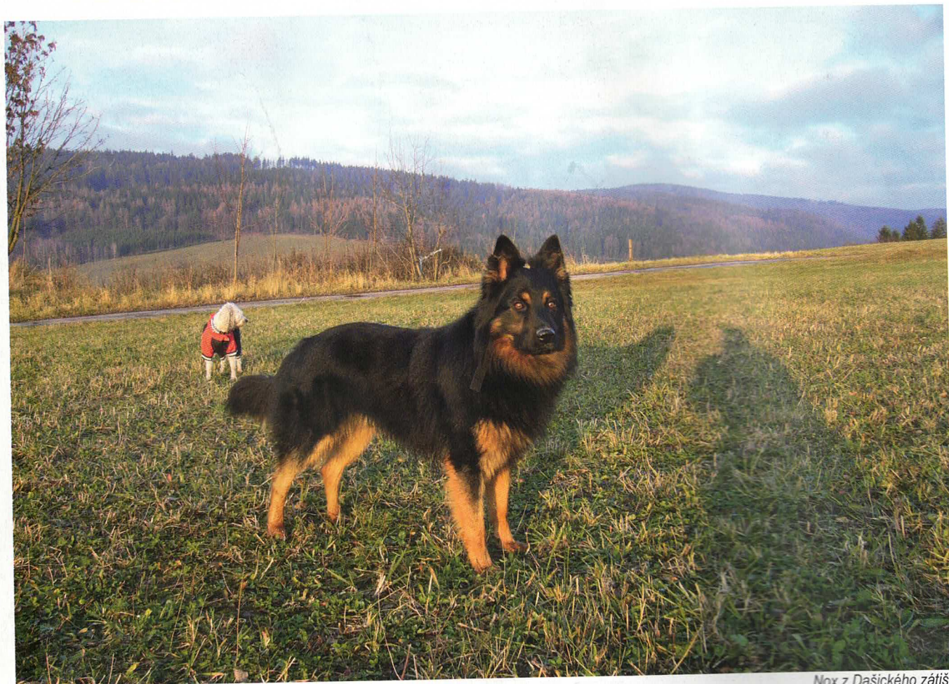
Nox z Dašického zatiší