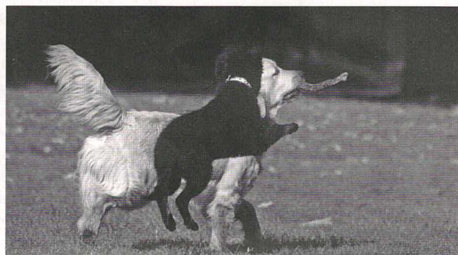
Wally z Dašického zátiší