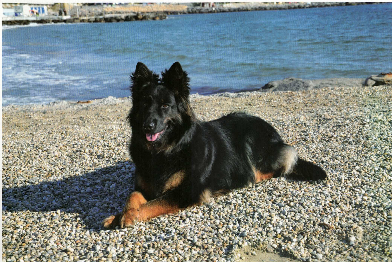
Dara od Sopečných vršků