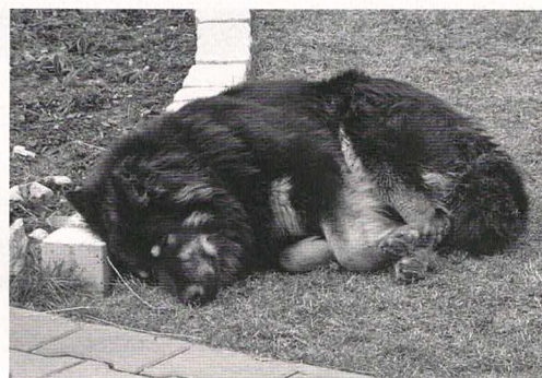
Dustin Calamity Jane