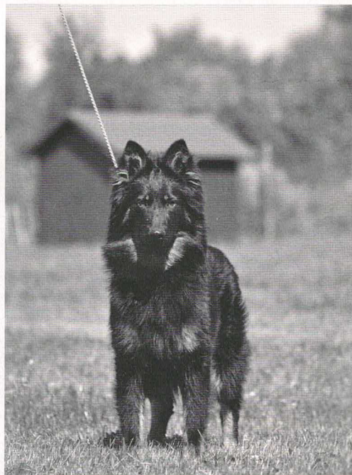
Anett Magic Inferno