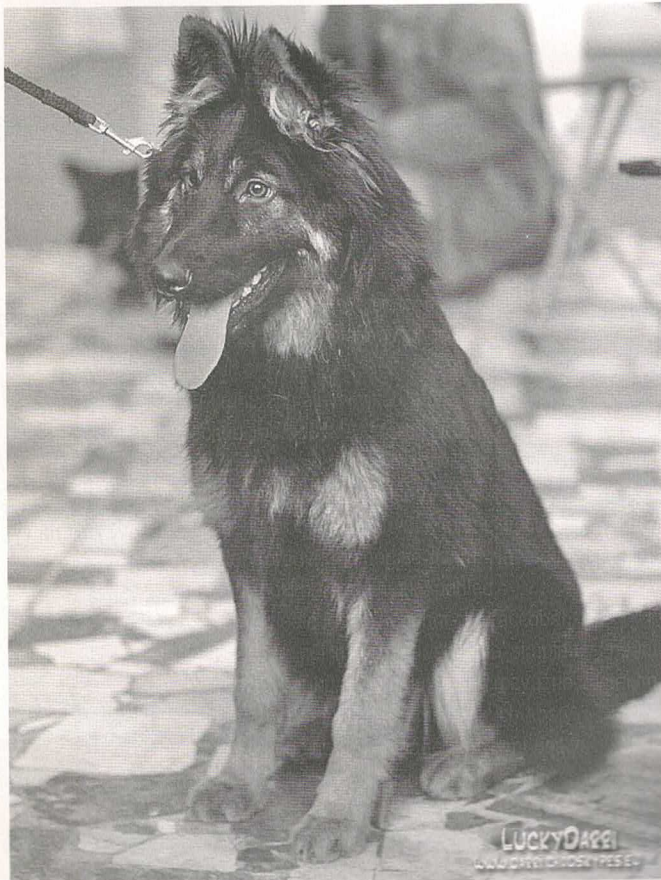
Caizare Chucky od Malého Kosíře