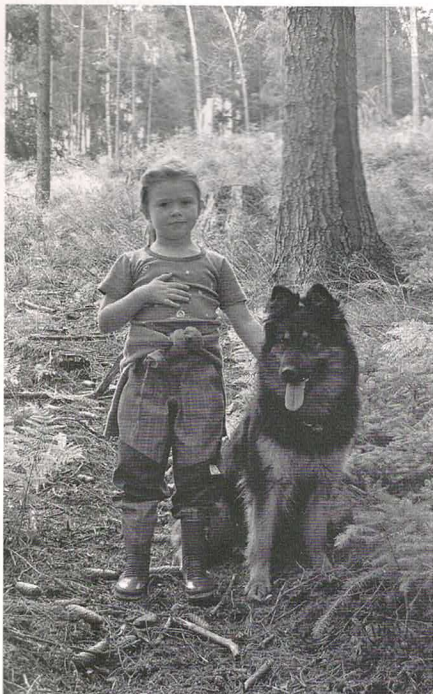
Nency z Dašického zátíší

Foto na I. a IV. obálce Zpravodaje 1/2011: Hádkanky na přístě