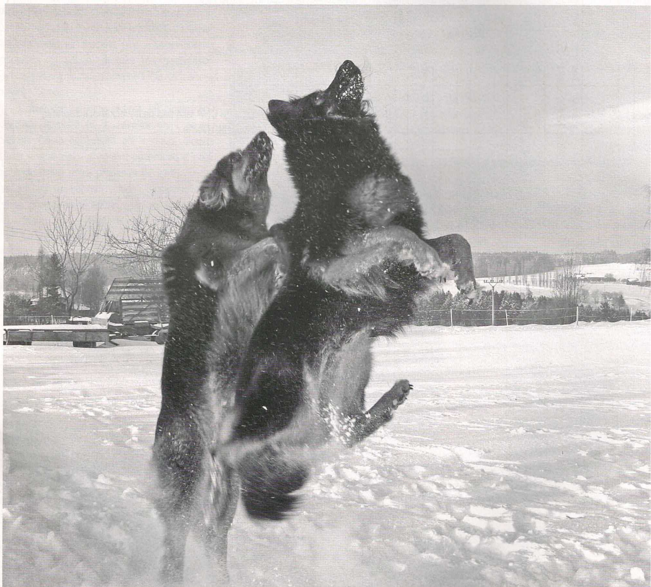
Angel z Čekova a Arwen od Perlového p