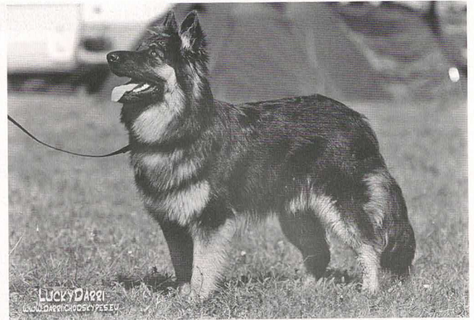
Darri Junior Calamity Jane