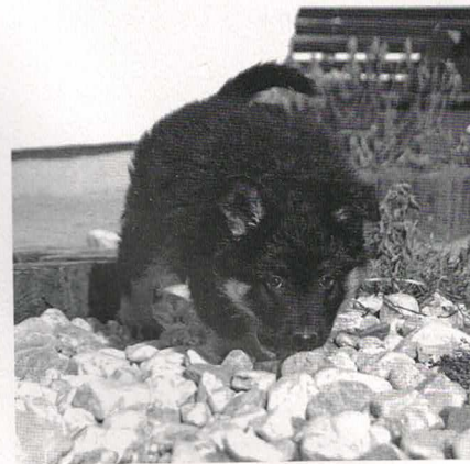
Barley Bett Chodák

Seznam členů KPCHP je průběžně aktualizován na webových stránkách klubu, spolupráce s webmasterem je výborná.