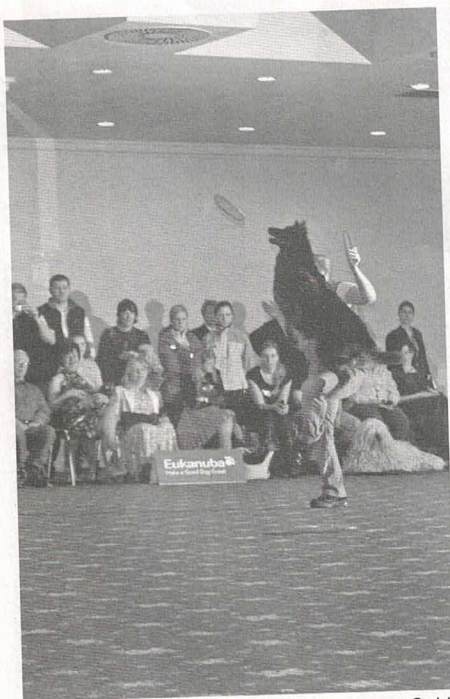
Palmirra Lukato Gold