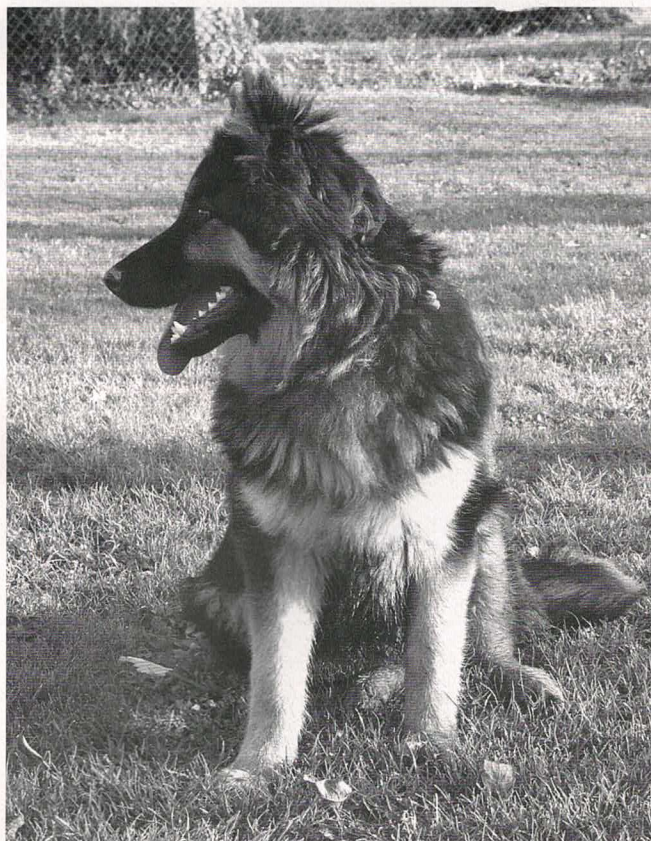
Lumpy Darri Daraskár