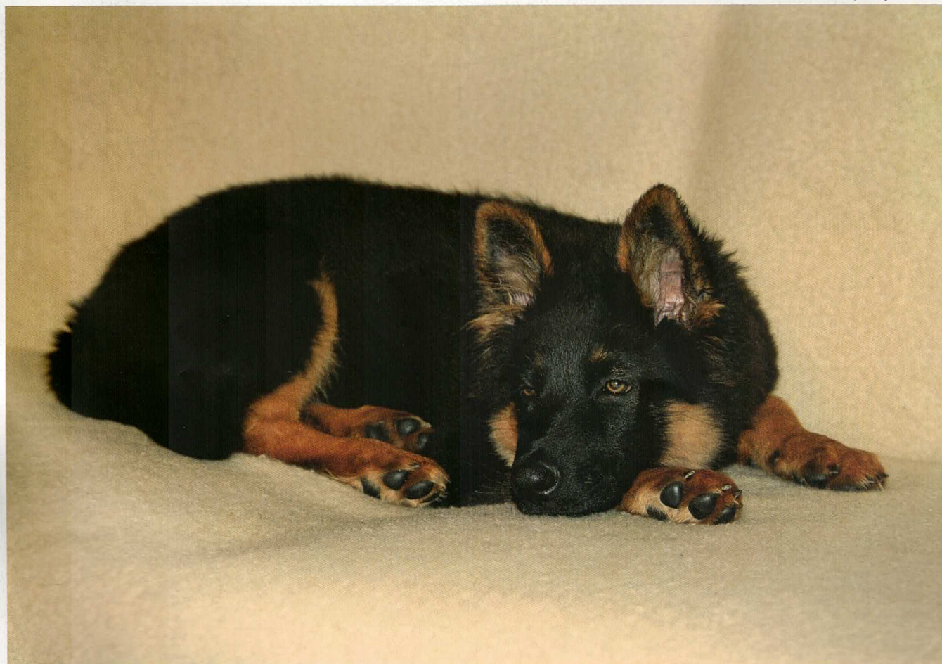
Draculus Regenia Bohemia