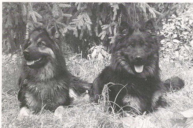
Acim a Atray Magic Inferno