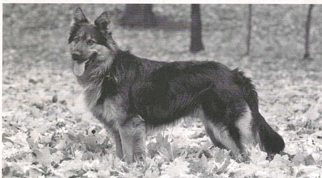
El Roy Western Star

Děkujeme všem majitelům chodských psů, kteří se výcviku věnují, za propagaci plemene na různých sportovních akcích a přejeme jim i jejich psům hodně úspěchů i radosti při dalším společném cvičení.