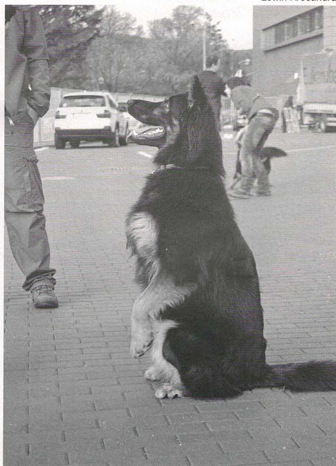
Vief z Dašického zátíší