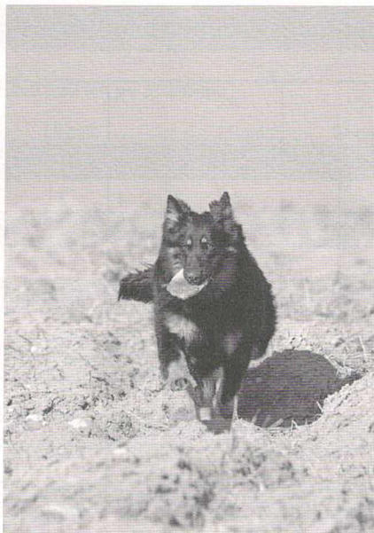
Wendy z Dašického zátiší