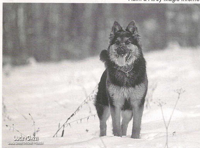
Aira Mont de Soleil