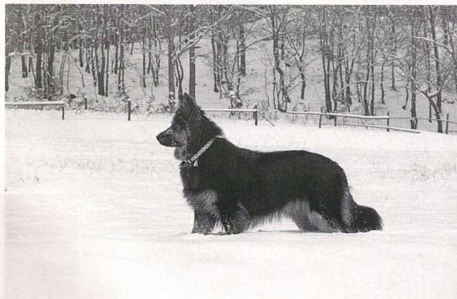
Funny z Aglobern