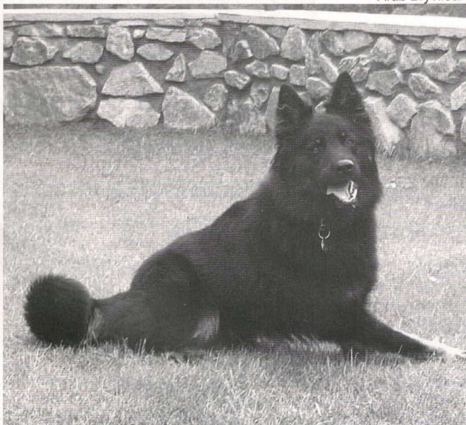
Darling Black Calamity Jane