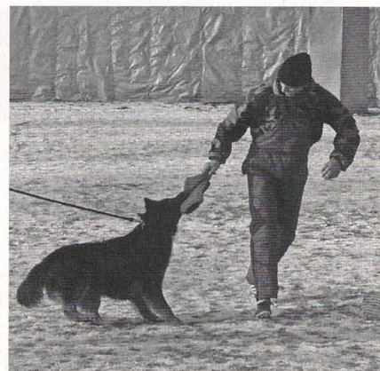
Black z Janiny

Výše uvedené komise a osoby organizované vykonávají činnost v rámci KPCHP, spolupracují s výborem klubu a na jejich potřeby je pamatováno v rozpočtu klubu na daný kalendářní rok.