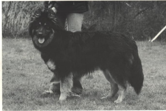
Bak Červený trpaslík