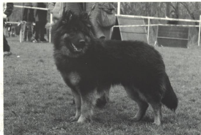
Atrey z Městcekého mlýna