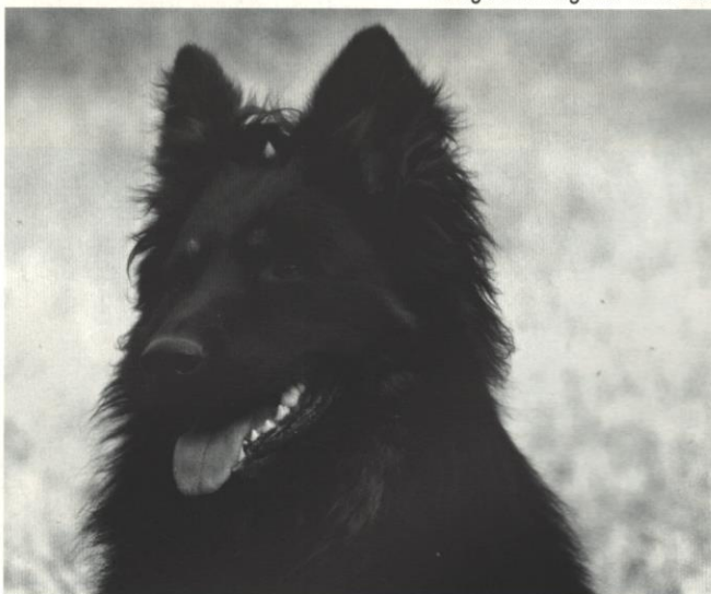
Ellegantus Regenia Bohemia