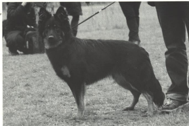
Astra z Dašického zátíší