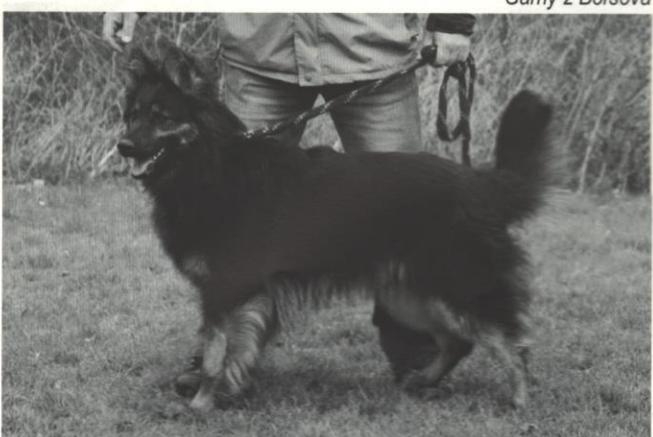
Goryk z Boršova