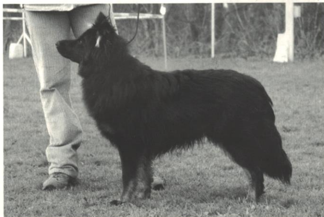
Arko z Dašického zátíší