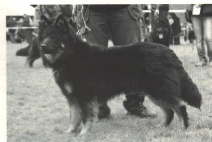
Artush z Městeckého mlýna

Pro plemeno chodský pes je jednoznačně nejvýznamnější účast na výstavě KLUBOVÉ , nebo SPECIÁLNÍ .