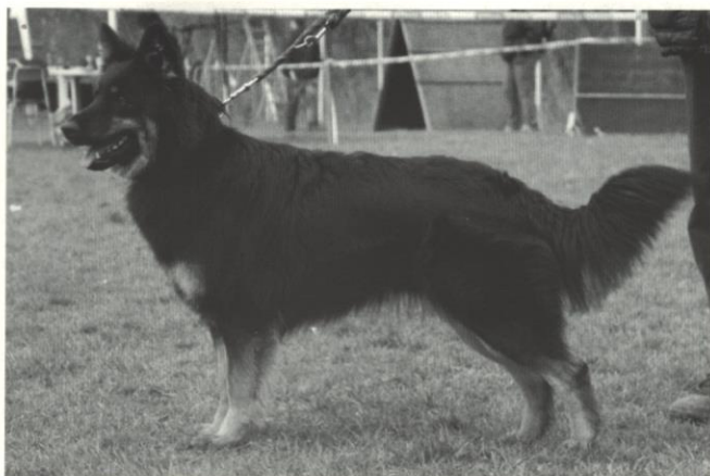
Cilka z Melechovské stráně