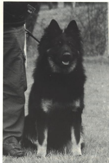
Felicitus Regenia Bohemia

Sacharidy jako zdroj energie nejsou pro psa zcela nezbytné, pokud má k dispozici dostatečné množství bílkovin a tuků. Jejich přítomnost v přiměřeném (ne příliš velkém) množství je ale výhodná, protože jsou rychlým zdrojem energie a pomáhají psům (na rozdíl od koček) šetřit bílkoviny. Jejich metabolické zpracování je jednodušší než u bílkovin a dochází při něm k menšímu zatížení jater a ledvin. Zvláště důležitý je dostatečný obsah sacharidů u březích a kojících fen, protože mají v tomto období zvýšenou potřebu glukózy. Nadbytek sacharidů působí ale nepříznivě. Může vést ke vzniku obezity a přispívá také k rozvoji diabetu. Sacharidy v nadměrném množství snižují výkonnost a vytrvalost a u predisponovaných zvířat mohou dokonce podporovat nádorové bujení. Pes by měl mít v krmné dávce asi 20 – 30 % stravitelných sacharidů (cukry, škrob), jejich množství by nemělo přesáhnout 50 %. U méně kvalitních granulí, založených na obilných šrotech, jich ale bývá daleko více. Obsah sacharidů v granulích většinou nebývá uváděn na obalu, ale dá se orientačně zjistit poměrně snadno. Když od 100 % odečteme procenta bílkovin, tuku, vlhkosti (bývá maximálně do 10 %), vlákniny (většinou do 5 %) a popela (většinou do 8 – 9 %), zbylá procenta představují tzv. bezdusíkaté látky výtažkové, jež zahrnují především cukry a škrob. V kvalitnějších granulích se obvykle pohybují mezi 30 – 40 %, u vysokoproteinových bezobilných receptur (například Orijen) bývají pod 30 %.