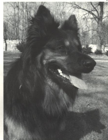
Rex Prima Nova