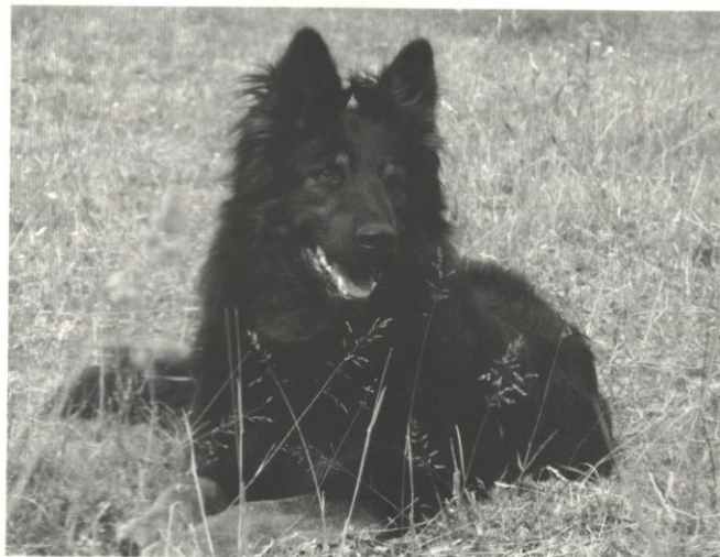
Black z Janiny