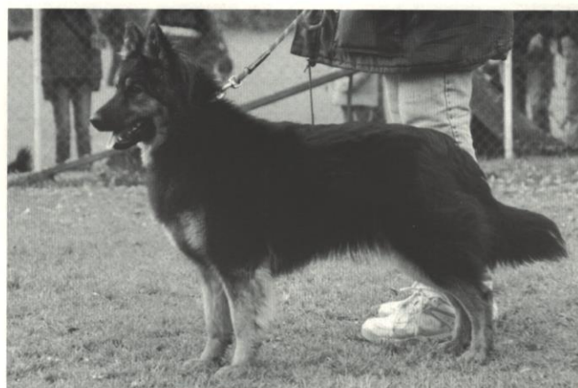
Eimý z Horské samoty