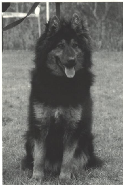
Bad Dajoar Geren

Svod dorostu slouží k posouzení vhodnosti rodičovského spojení. Vrh je možno ukázat jako celek. Jedinci jsou však posuzováni pouze ve srovnání se standardem. Majitelům může svod dorostu poskytnout první představu o kvalitě jejich jedince jako představitele plemene a obvykle jim umožní vidět další sourozence z vrhu.