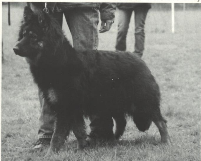
Estel od Lužničky