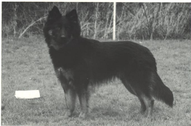
Grimm z Boršova