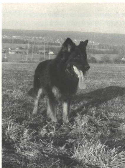
Bastien Magic Inferno

Správná výživa psů je oblíbené a mezi chovateli často diskutované téma. Názory na to, jak psa kmit co nejlépe, nejsou jednotné a často bývají ovlivněny různými polopravdami, nepodloženými fámami a v neposlední řadě i obchodními zájmy firem vyrábějícími krmiva pro psy.