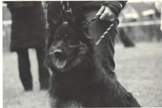
Baxter Temný onyx