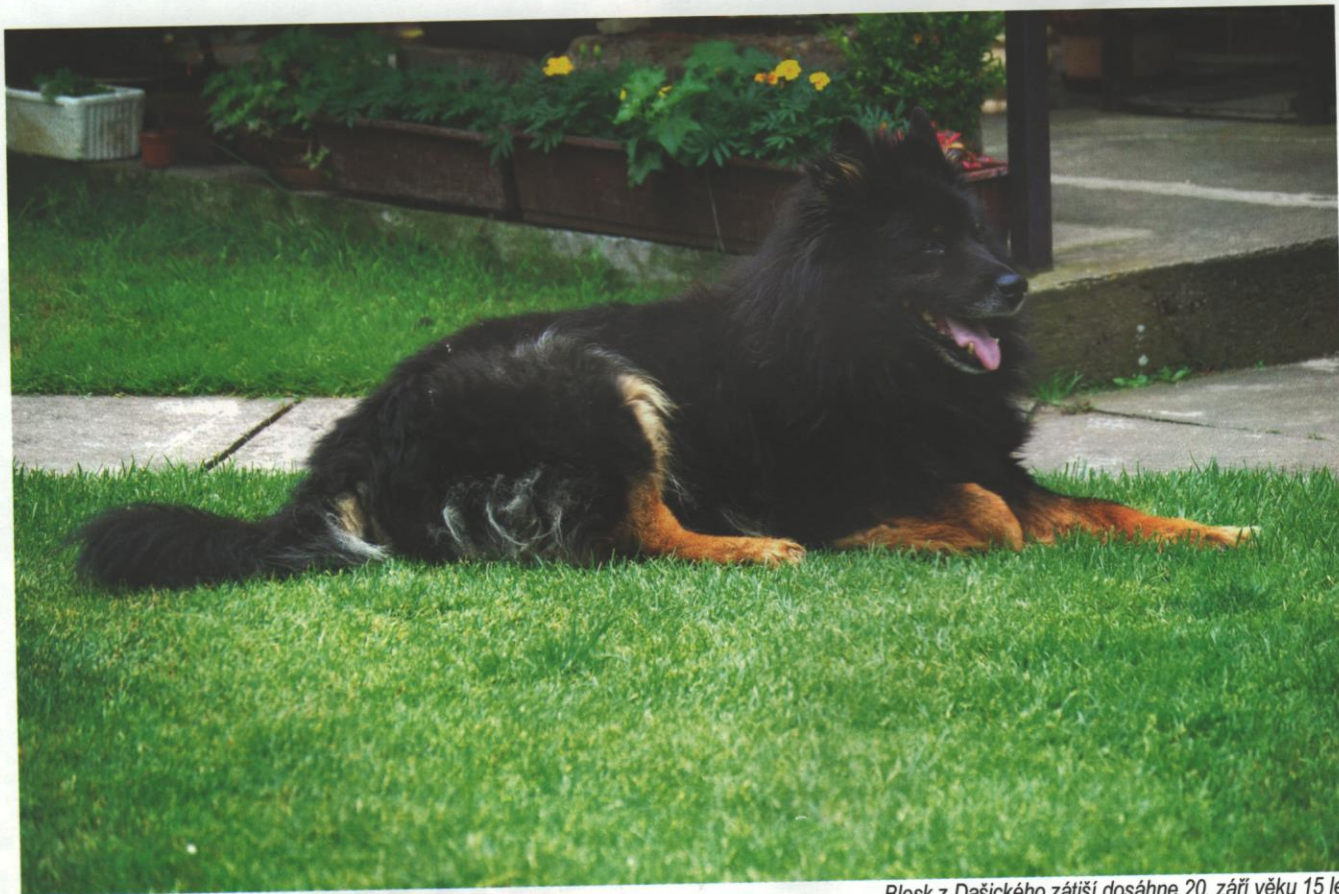
Blesk z Dašického zátiší dosáhne 20. září věku 15 let