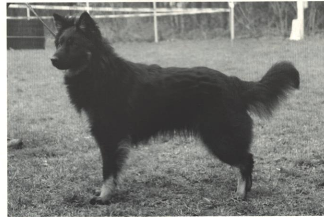
Carrie Magic Inferno