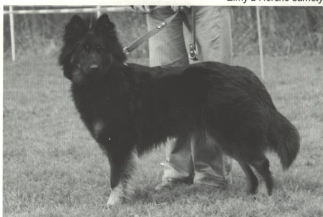
Gamela z Boršova