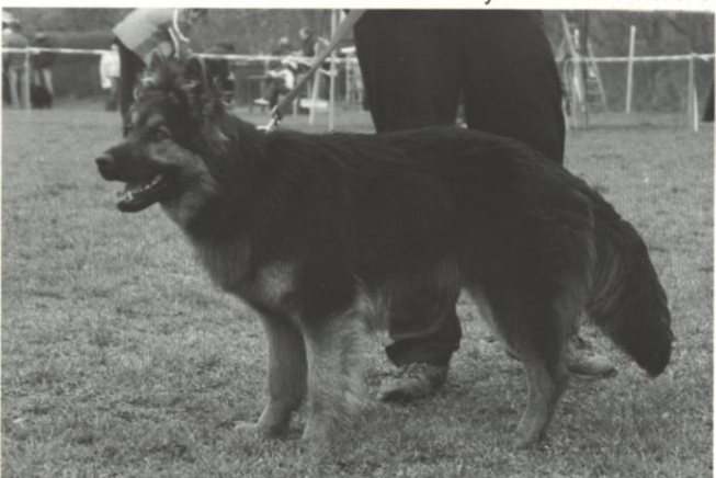
Cleo Magic Inferno