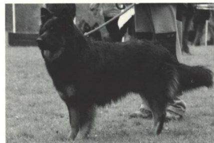
Ašar z Městeckého mlýna

Jsou různé úrovně výstav. Od krajských po mezinárodní. Podle toho se liší i „závažnost“ zadávaných titulů, množství psů, které je možné na nich vidět, atd.