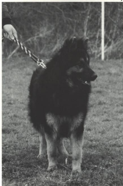
Zanziba Cecille Lukato Gold