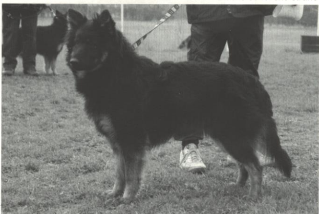
Cony z Melechovské stráně