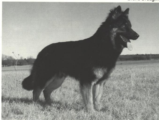
Fin od Strážné skály