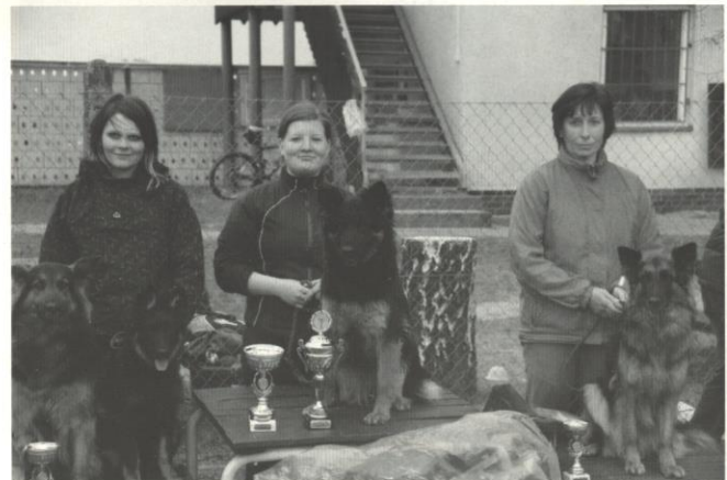
Black z Janiny, Ellegantus Regenia Bohemia, Fanny z Aglobem, Gass Stamo-Bud, Rouzie z Dašického zátiší