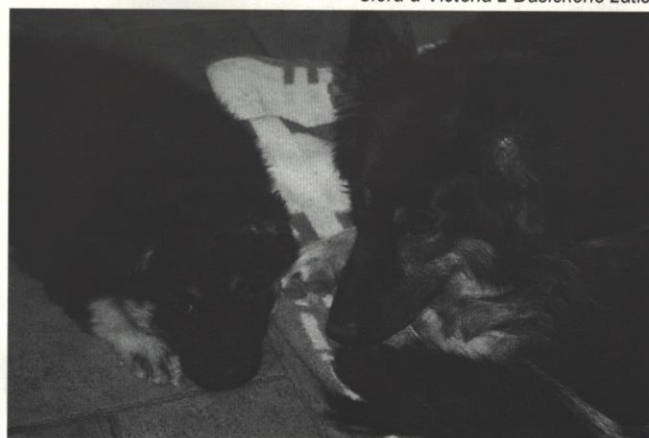
Clera a Victoria z Dašického zátiší