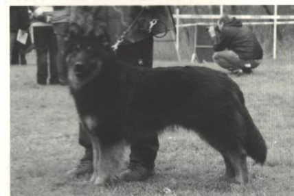
Akim z Městeckého mlýna

Schází se na nich největší „konkurence“ (zatímco na jiných typech výstav zájemce o chodské psy často najde i jen okolo 10 jedinců, na těchto se dnes schází pravidelně okolo 90 zvířat a počty se průběžně navyšují) a posuzuje je pozvaný odborník na plemeno.