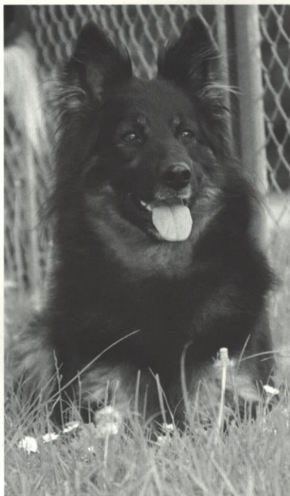
Arwen od Perlového potoka