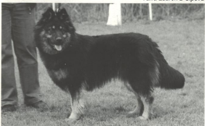
Zefira z Dašického zátiší