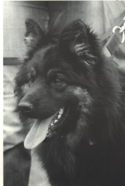
foto nahoře: Ultimate Speed z Gipova foto dole: Alwin z Městceckého mlýna