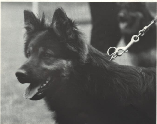
Bennet Temný onyx