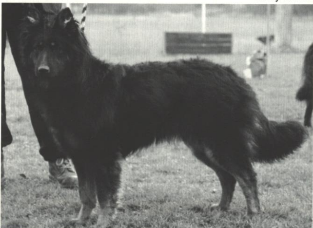
Hettie Zelený kámen