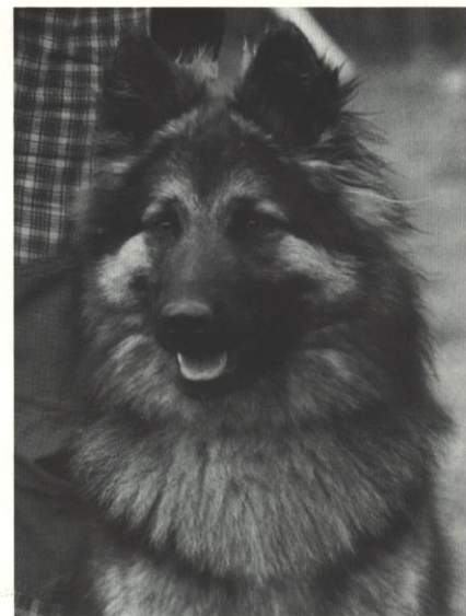
Debbie Lužanské hvězdy