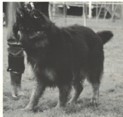
Horatio Zelený kámen

zeně chrání masožravce před poraněním trávicího traktu ostrými úlomky kostí a dalších pevných částí kořisti. U domácích psů, jejichž strava se během dlouhodobého soužití přizpůsobila potřebám člověka, není tato ochrana vždy spolehlivá. Hodně záleží i na způsobu krmění. U psů dlouhodobě krměných výhradně mletými směsmi nebo průmyslovými krmivy nedochází k dostatečné stimulaci jehlového reflexu a ten může údajně asi do dvou let vyhasnout.