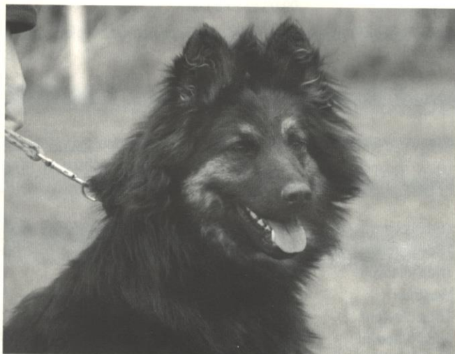
Dottie Lužanské hvozdy