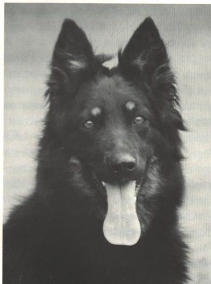
Christa od Strážné skály

stravitelné a obsahují potřebné esenciální aminokyseliny. Rostlinné bílkoviny jsou hůře stravitelné a nejsou biologicky plnohodnotné. Gluteny (= lepek) z obilovin jsou velmi chudé na esenciální aminokyselinu lysin, sojový protein má zase velmi málo metioninu. Pšeničný gluten a sojový protein jsou navíc častými příčinami potravních alergií. Z údajů na pytlí s granulami jen těžko poznáme, odkud bílkoviny pocházejí a jaká je jejich kvalita. Obsah proteinů, který bývá uvedený na obalu, je ve skutečnosti pouze tzv. hrubý protein, tedy celkový obsah všech látek, které ve své molekule obsahují dusík. Nemusí se dokonce ani vždy jednat o bílkoviny. Určitým vodítkem k posouzení kvality bílkovin v krmivu může být seznam použitých surovin, který je výrobce povinen uvádět v sestupném pořadí. Pokud se na předních místech objevují obiloviny (pšenice, kukuřice), doplněné navíc pšeničným, kukuřičným, rýžovým glutenem nebo sojovým proteinem, nemůžeme očekávat velkou kvalitu bílkovin. Zdroj kvalitních bílkovin zajišťují především živočišné zdroje, nejlépe kvalitní (jednodruhové) masové moučky.