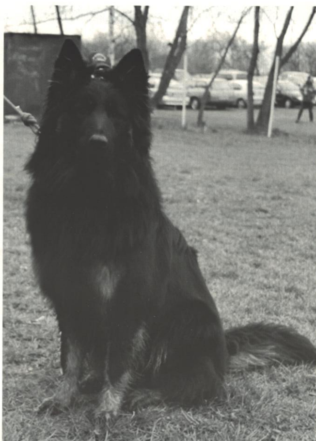
Bery Červený trpaslík