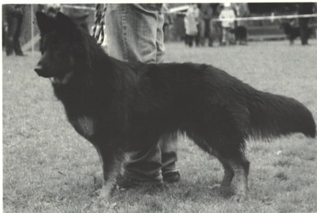
Arissa u Třech tújí