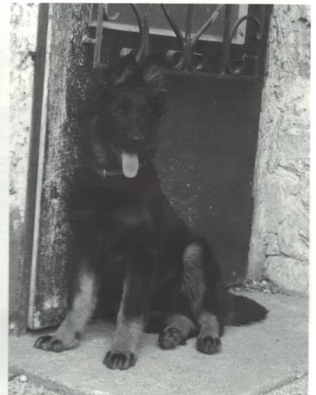
Uriáš z Gipova