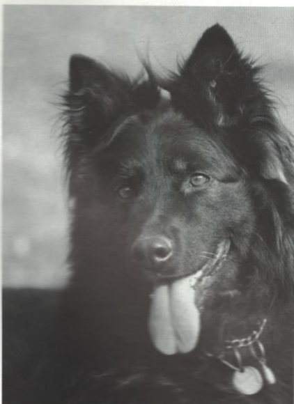
Vick od Strážné skály