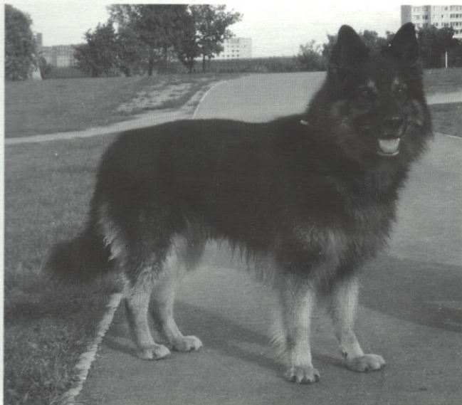
Falk od Strážné skály