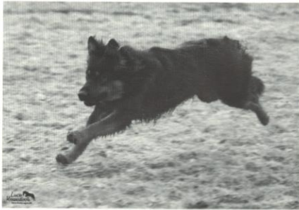
Ariel od Sázkavského splavu

zvané kolostrum (mlezivo) končí a fena štěňata kojí normálním mlékem, které se však od toho, co běžně kupujeme v obchodě, složením dosti výrazně odlišuje především vyšším podílem bílkovin a tuku, ale i minerálních látek a vitamínů.