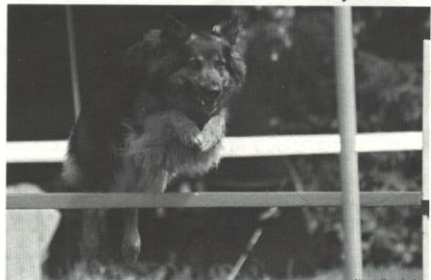
Meibless z Dašického zátiší