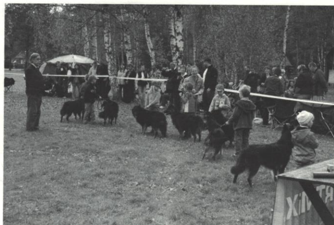
soutěž Dítě a pes v Hradci Králové