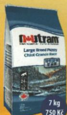
Large Breed Puppy Stěně velkého plemene