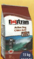
Active Dog Dospělý pes aktivní