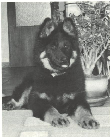
Bad z Chrámeckých vinic