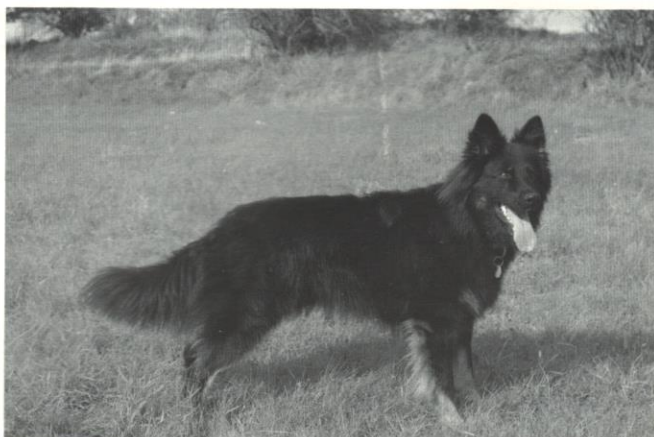
Dustin Lužanské hvozdy