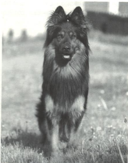
Funny z Aglobern

Předs. klubu pí Kudrnáčová přivítala přítomné a zahájila členskou schůzi. V úvodu poděkovala za účast všem, kteří se schůze zúčastnili.