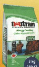
Allergy Care Dog Dospělý pes s alergií