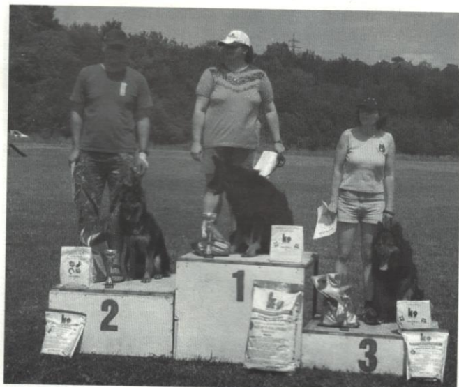
Vítězové kategorie B