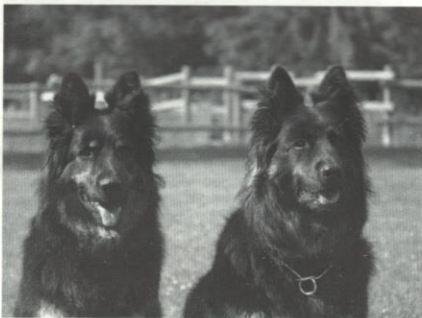
Vesna z Dašického zátiší Dara od Sopečných vršků

Za několik hodin, někdy i po celém dnu na "fázi neklidu/přípravou fázi" navazuje vlastní porod. Tomu by měl být chovatel bezpodmínečně přítomen, ať už bude jeho asistence zapotřebí, nebo ne. Ostatně to nemůže bezpečně předem vědět ani sebezkušenější chovatel. Tím vás nechceme nijak vyděsit, většina porodů probíhá naprosto normálně, nicméně jistá ostražitost je vždy na místě. Také není na škodu se předem domluvit s vaším veterinářem, zda by byl ochoten v případě komplikací zaskočit nebo na koho se máte obrátit v době jeho nepřítomnosti. Zvláště chovatelé plemen jako jsou angličtí buldoci, francouzští buldočci, bostonští teriéři, toy apod., kde je riziko větší, by na to rozhodně neměli zapomenout. Právě u nich vyvstává častěji než u jiných nutnost provést císařský řez, a to už je samozřejmě záležitost pro odborníka.