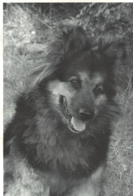
Gerta na Strehovej

Výše uvedené komise a osoby organizované vykonávají činnost v rámci KPCHP, spolupracují s výborem klubu a na jejich potřeby je pamatováno v rozpočtu klubu na daný kalendářní rok.