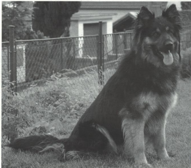
Dorien z Letinské kovárny