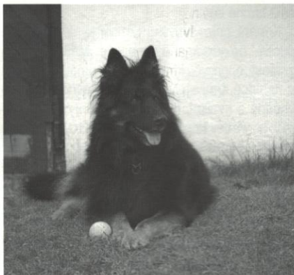
Chabrun od Majky

bývá 10 – 270 sekund. Po opuštění extruderu jsou granule horké, měkké a jejich vlhkost je 25 – 27 %. Aby se nezakazily, musí následovat sušení na požadovanou vlhkost 8 – 10 %. Dále se chladí a provádí se finální úpravy, nástřik tuků a zchutňovačů na povrch granulí.