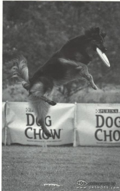
Funny z Aglobern