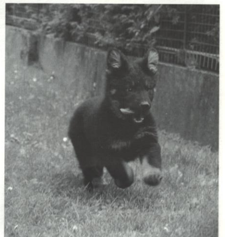
Bodie z Dašického zátiší