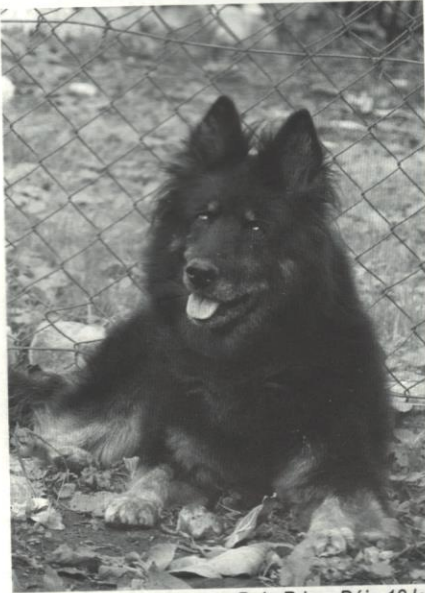
Bela Prima Dája 13 let

Správná výživa psů je oblíbené a mezi chovateli často diskutované téma. Názory na to, jak psa krmit co nejlépe, nejsou jednotné a často bývají ovlivněny různými polopravdami, nepodloženými fámami a v neposlední řadě i obchodními zájmy firem vyrábějícími krmiva pro psy. Proto přinášíme pokračování z minulého čísla.