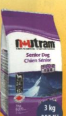
Senior Dog Starší pes

(Nutram pro psy zakoupíte i v balení: 3 kg / 7 kg / 15 kg)