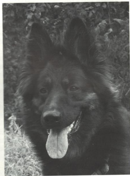
Ornela Mag z Gipova

Rozhodli jste se stát se chovateli, gratuluje. Buďte však připraveni na vše. Těchto několik rad Vám pomůže úspěšně zvládnout porod Vaší fenky.