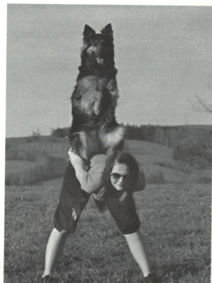
Meiblees z Dašického zátiší