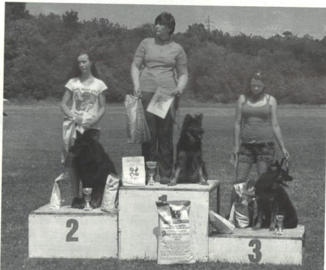
Vítězové kategorie A