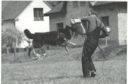
Nox z Dašického zátiší