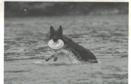
Sangria z Gipova

Nemáte-li zkušenosti s chovem psů, doporučujeme do 24hodin po porodu fenu a štěňata vyšetřit u veterinárního lékaře! Ultrasonografické vyšetření dělohy feny může odhalit zadržovaný plod nebo lůžko. Vyšetření štěňat je dobré pro posouzení některých vývojových vad (rozštěp patra, přebytek prstů na pánevních končetinách, nedostatečně uzavřená dutina břišní atd.)