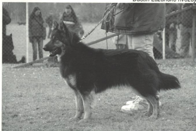
Eimy z Horské samoty