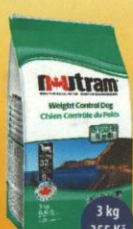
Weight Control Dog Dospělý pes - kontrola hmotnosti