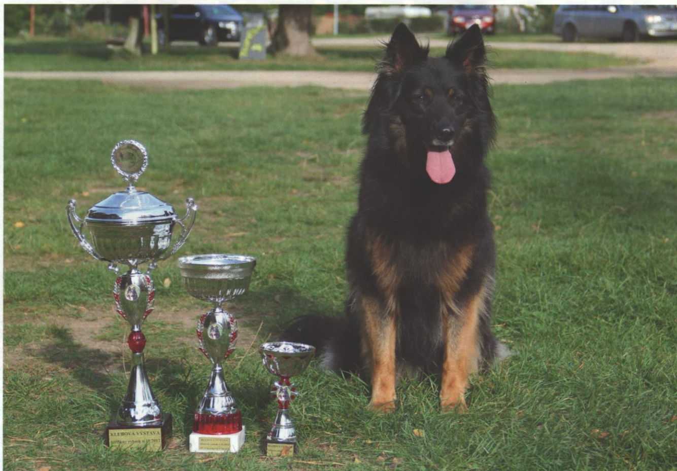
Arwen od Perlového potoka – klubová výstava BOB