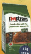
Lamb&Rice Adult Dog Jehněčí s rýží pro dospělého psa