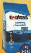
Adult Dog Dospělý pes