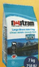
Large Breed Adult Dog Dospělý pes velkého plemene