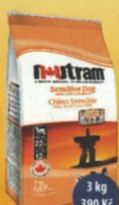
Sensitive Dog Citlivý pes - kůže, srst a zažívání