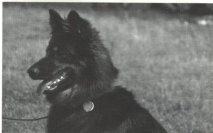
Destiny Vita canina

Stejně jako pro lidská miminka, i pro ta psi je ideální, když má jejich matka dostatek mléka a může je kojit. Pochopitelně to chovatelé ušetří mnoho problémů, o jejichž existenci nemá často ani tušení, a umožní mu to prožít první dny a týdny štěňat v klidu. Může se však stát, že fena mléko nemá, nebo ho má málo. Záhy to i laickým očima rozpoznáme na chování štěňat: budou neklidná, stále častěji se budou hlasitě ozývat, nebudou přibírat na váze či dokonce začnou viditelně hubnout. V takovém případě budeme donuceni chtít nechtě přistoupit k umělé výživě. Útěchou nám může být, že na rozdíl od časů nedávno minulých, kdy byli chovatelé nuceni řešit takové případy svépomocí a složitě sestavovat náhradní krmné dávky, dnes je to přece jenom jednodušší. Renomovaní výrobci psí potravy nabízejí velmi kvalitní sušená mléka pro štěňata, kde je zaručeno stále ideální složení. Přesto je odchov štěňat bez matky velmi náročný na čas i trpělivost chovatele. Zpočátku je nezbytné krmit každé dvě až tři hodiny, teprve až po 10 - 14 dnech můžeme interval prodloužit na 4 hodiny a po dalším týdnu postupně přecházet na krmení pevnou stravou.