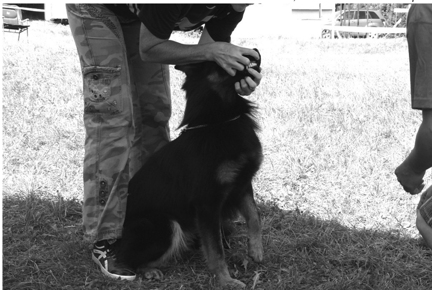
Lančov, ukázka zubů Vendeta z Gípova