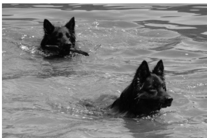
Urias a Lexus Speed z Gipova

Dlouholetý webmaster oznámil ukončení činnosti pro KPCHP. RK ocenila rychlou reakci výboru, převzetí agendy a zajištění plynulého chodu webových stránek klubu zajištěním nového webmastera. Zároveň se však RK domnívala a předložila jako podnět výboru, že by mělo být na post webmastera do konce roku vypísáno a provedeno výběrové řízení. Výbor klubu následně rozhodl, že výběrové řízení, vzhledem k již započaté práci nového webmastera, nebude vypisovat. RK rozhodnutí respektuje.