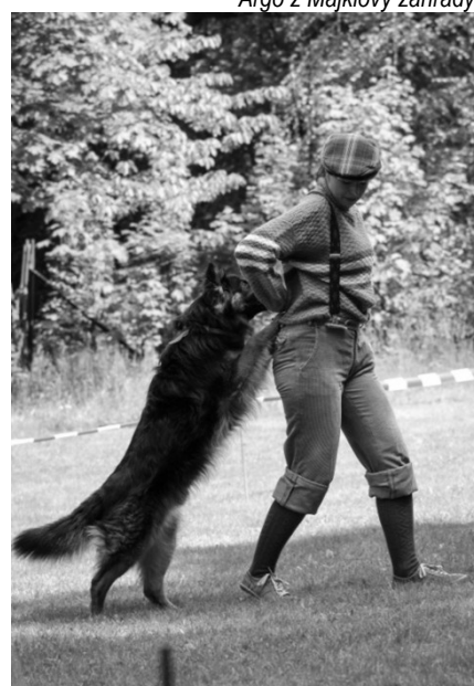
Argo z Majklovy zahrady