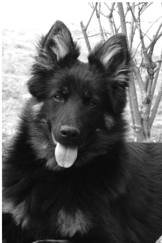
Vendeta z Gipova