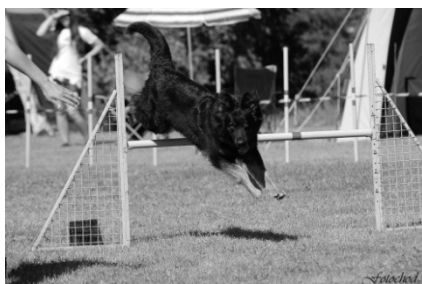
Cira od Motyčinské skály

Mistrem ČR pro rok 2014 se suverénně stala Airin Porta Moravia, která s páničkem na place neměla prostě konkurenci. Nejlepším veteránem ČR pro rok 2014 se stala Amarethy Fidelis et Fortis. Letos se vyhodnocoval i nejlepší nováček, tedy ten, který začal závodit v tomto roce, a tím se stala Tullamore Dew Lukato Gold. Také se nezapomněl ocenit tým, který se MR zúčastnil nejčastěji a to byla Meiblees z Dašického zátiší, která vynechala pouze jeden ročník! Moc všem gratulujeme a těšíme se na další ročník ☺