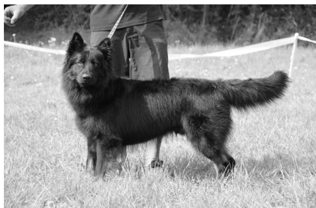
Ickx Vítá Canina