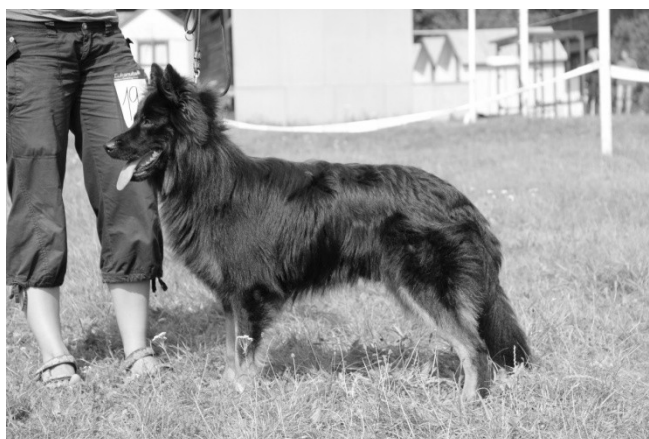
Or Brilliant Daraskár