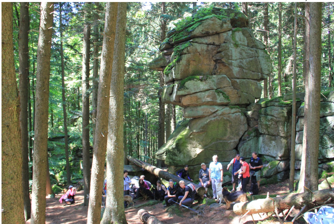
Účastníci 5. prodlouženého víkendu s Vickem od Strážné skály v Rakousku