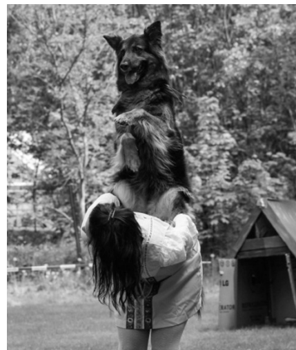
Meiblees z Dašického zátiší