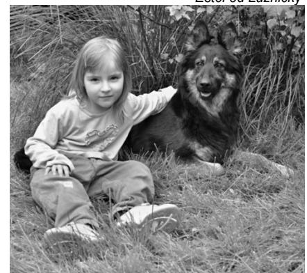
Estel od Luznický