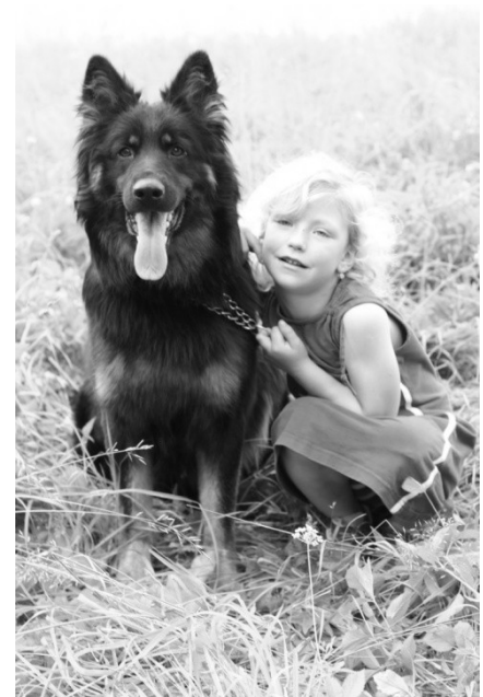
Centaurus Fidelis et Fortis

Uvedené komise a osoby organizovaně vykonávají činnost v rámci Klubu přátel chodského psa, spolupracují s výborem a na jejich potřeby připravuje rozpočet klubu na daný kalendářní rok.