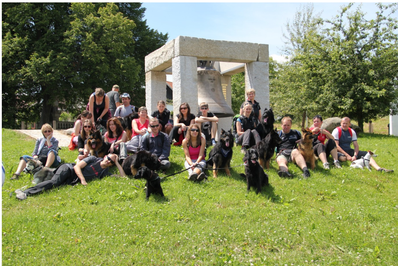
Účastníci 5. prodlouženého víkendu s Vickem od Strážné skály v Česku