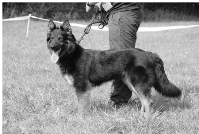
Drina Mont de Soleil