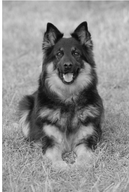
Orchidea Lukato Gold

mají i kumulativní účinek, a proto i chronické podávání malých množství může velmi škodit. Dochází k zátěži orgánů, hlavně ledvin, jater a sleziny. Obvykle nejsou akutní smrtelné otravy, ale v následku selhání orgánů. Obvyklé je poškození tkání při nedokrvení, hlavně okrajových (uši, prsty, ocas) a díky zvýšené srážlivosti se mohou tvořit tromby a ucpávat cévy.