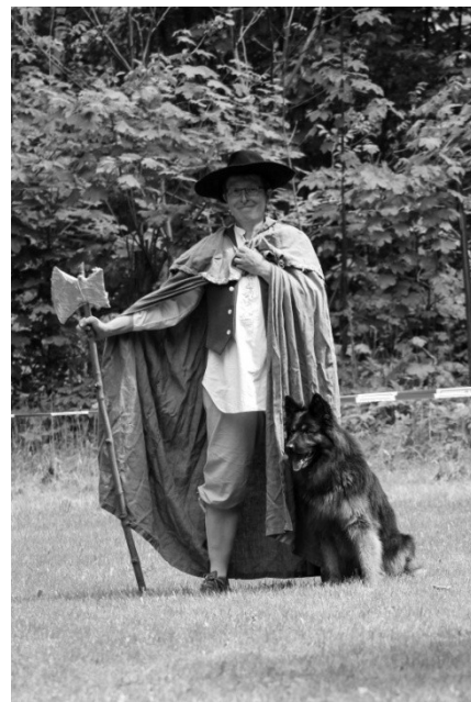
Garmy z Boršova