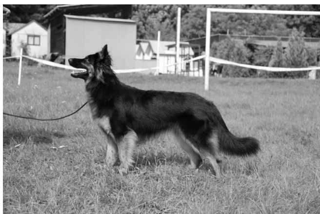
Ištar Vita Canina