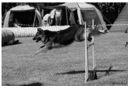
Tullamore Dew Lukato Gold

Mistrem ČR pro rok 2014 se suverénně stala Airin Porta Moravia, která s páničkem na place neměla prostě konkurenci. Nejlepším veteránem ČR pro rok 2014 se stala Amarethy Fidelis et Fortis. Letos se vyhodnocoval i nejlepší nováček, tedy ten, který začal závodit v tomto roce, a tím se stala Tullamore Dew Lukato Gold. Také se nezapomněl ocenit tým, který se MR zúčastnil nejčastěji a to byla Meiblees z Dašického zátiší, která vynechala pouze jeden ročník! Moc všem gratulujeme a těšíme se na další ročník ☺