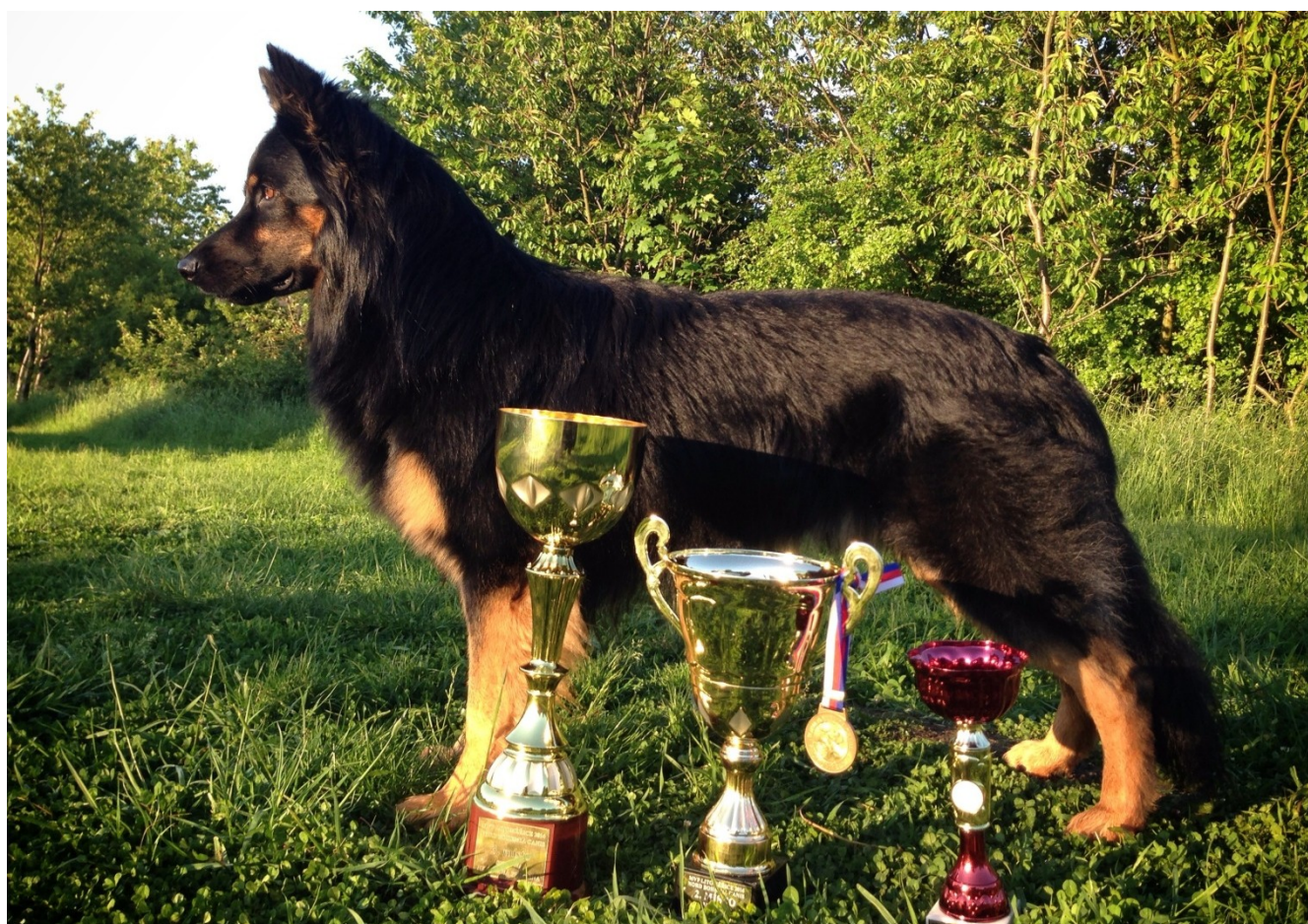
Akim z Čermenských lesů