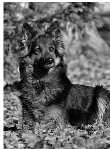
Meiblees z Dašického zátiší