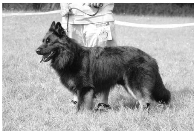
Endy El Bryvilsár