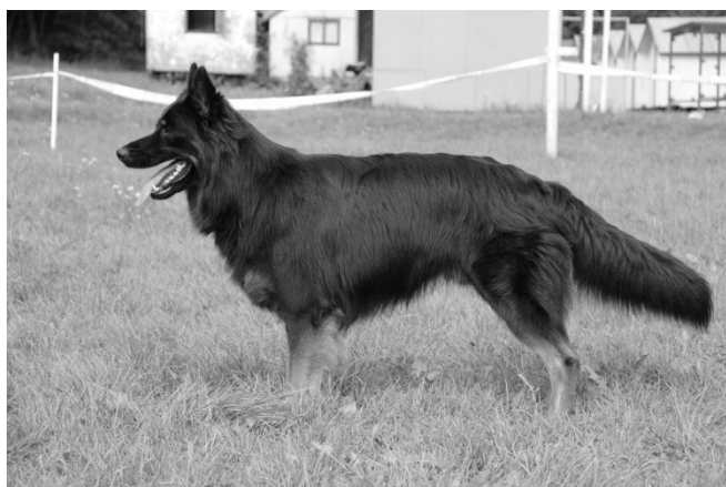
Centaurus Fidelis et Fortis