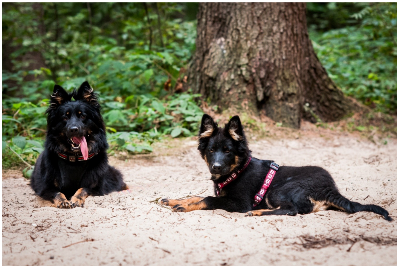
Engie Magic Inferno, Baghira Black Monster