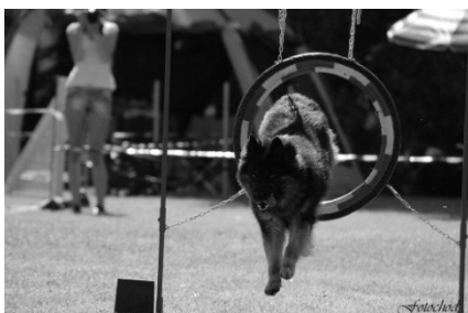
Zack z Dašického zátiší

I přes šílené vedro, které panovalo již od brzkých ranních hodin, všichni tvrdě bojovali a prali se se zárudnostmi parkurů. A choďáci opět nezklamali a své páničky i v těchto těžkých podmínkách podrželi a dělali do úsměvu těla. Byla krása sledovat porovnání sil choďáčků v tak silné konkurenci.