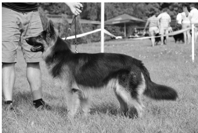
Dar Sargo Acacia Hill