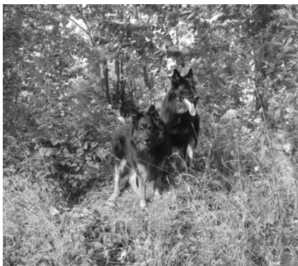
Nox z Dašického zátiší a Orsid Krosandra

Za toto období RK podala výboru klubu několik dotazů a podnětů a to i na základě podnětu od člena klubu.