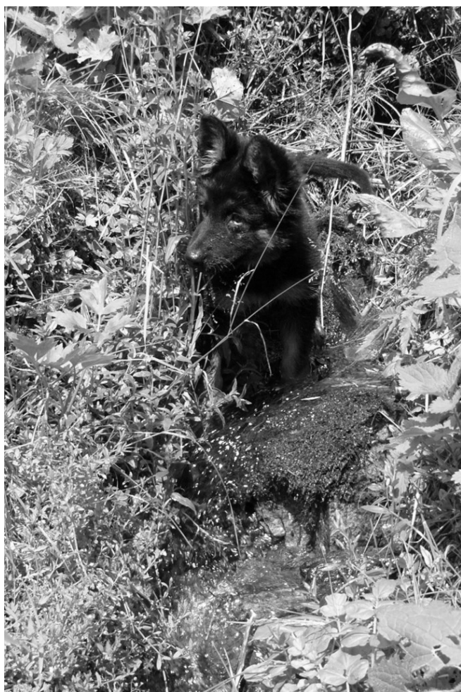
Witch Corra z Gipova