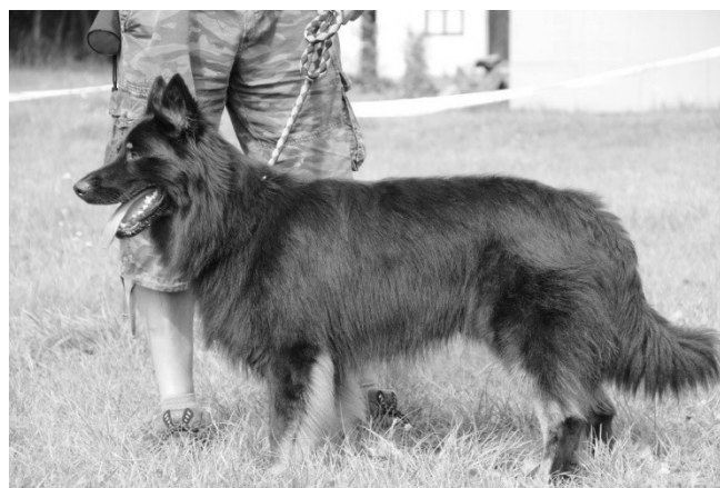
Dak od Perlového potoka