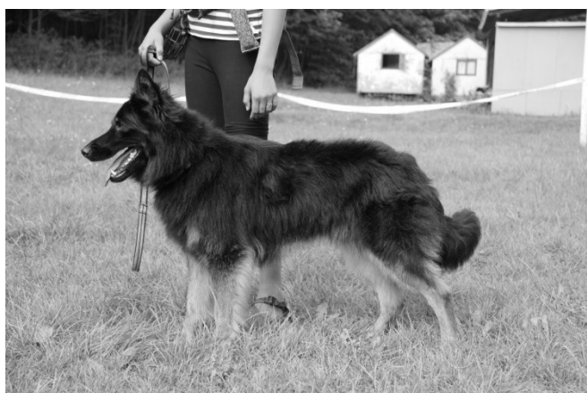
Cress Scany Chodák