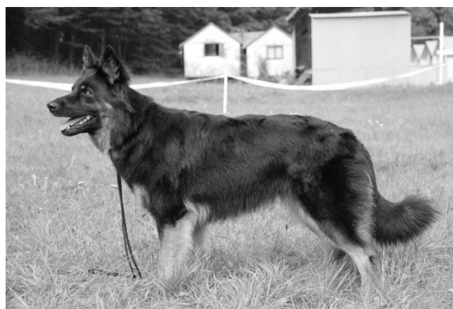
Cara Bardot Choďák