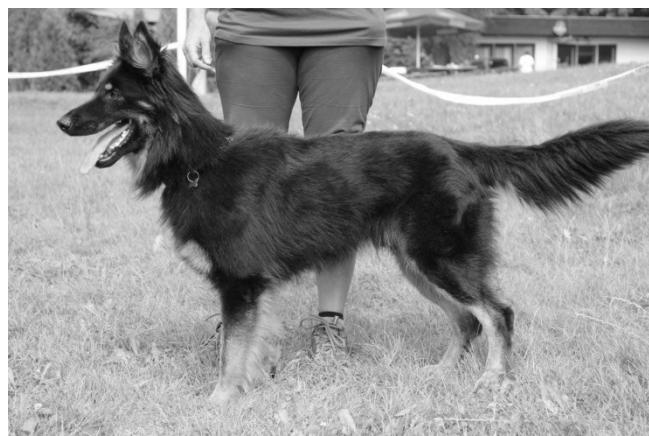
Akim z Nechyby