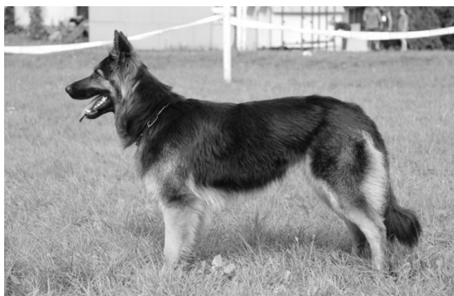
Dakota Daisy od Malého Kosíře