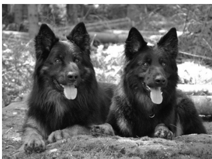
Lexus Speed z Gipova a Akram z Nechyby

Úkol trvá jen pro téma chov v zahraničí: - u psů uchovněných v zahraničí podle řádu FCI bude na jeho kartě u nadpisu CHOVNÝ uvedena země, kde byl uchovněn - do anglické a německé verze postupně přidávat weby zemí, kde se chová podle FCI (úkol Mohapelová, Peroutka, Kudrnáčová)