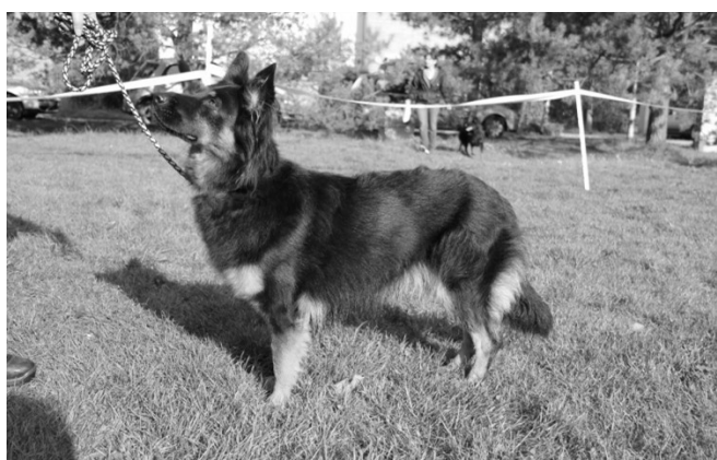
Cléra z Dašického zátíší