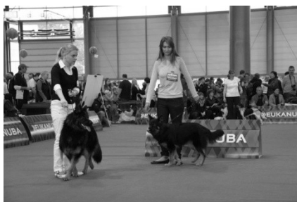
Amarook Black Mirabell V1, CAJC, WE Akirra de San Hostýn V1, CAJC, WE, BOJ

Dostali jsme také prostor chodského psa představit a pohovořit o jeho vlastnostech a schopnostech na tiskové konferenci. A i tam jsme zaznamenali zájem o naše plemeno, což nás velmi potěšilo.