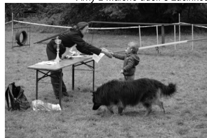
Army z Malého údolí s Lucinkou