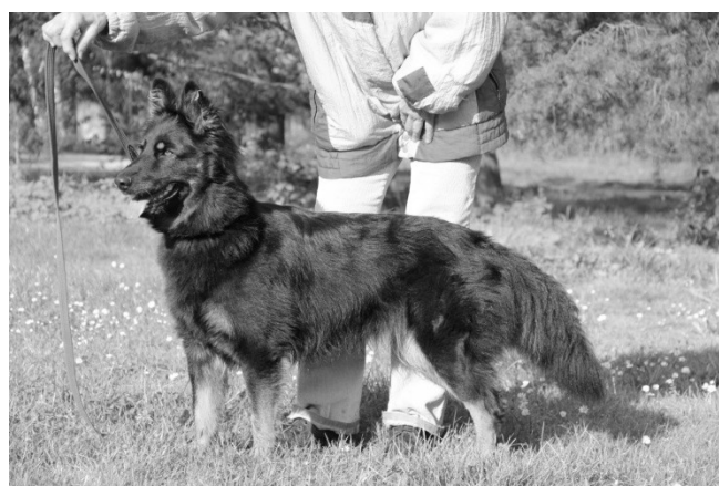
Era z Janiny