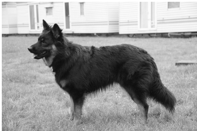
Chlupáč Argo Bryvílsár

Pořadatel akce nezodpovídá za škody způsobené psem ani za úhyn, zranění nebo ztrátu psa. Psi musí být klinicky zdraví a s platným očkováním. Neúčast na akci z jakýchkoliv příčin nezakládá nárok na vrácení poplatků. Háravé feny se mohou účastnit bonitace, nahlásí však tuto skutečnost u přejímky, fena zůstane mimo areál a nastupuje k posuzování jako poslední. Majitel souhlasí s uveřejněním fotografie svého psa/feny z této akce na stránkách klubu a v klubovém Zpravodaji.