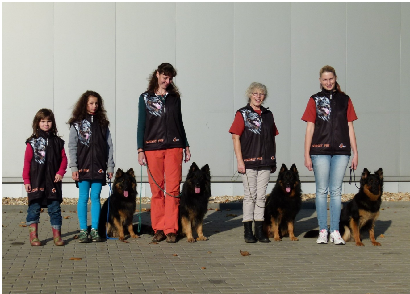
Pikao Daraskár, Bady Acacia Hill, Ortis Vigilo, Ariel od Sázavského splavu