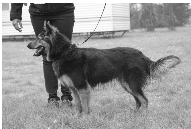
Aura pod Chlumem