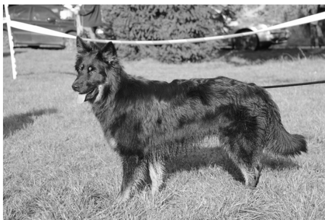
Bella od potoka Lubě