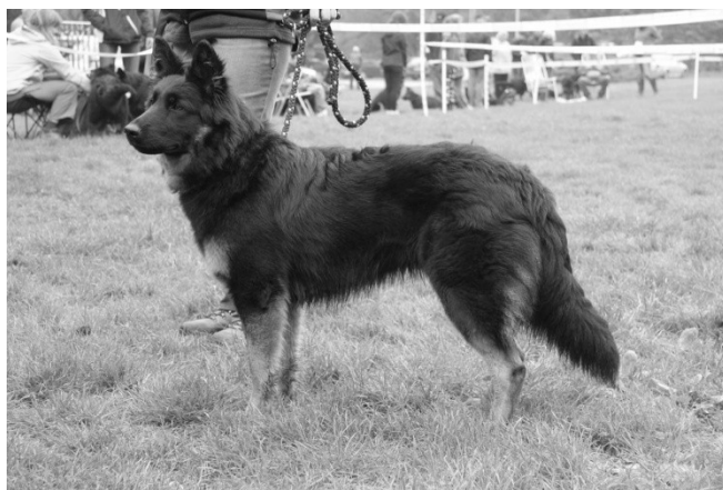
Asta z Hájenska