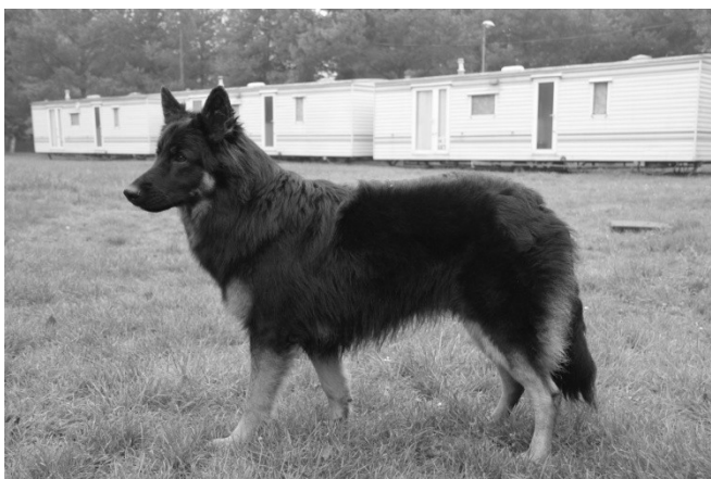
Aslan z Hájenska