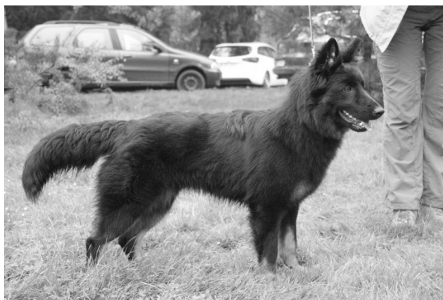
Barny z Příborského dvora