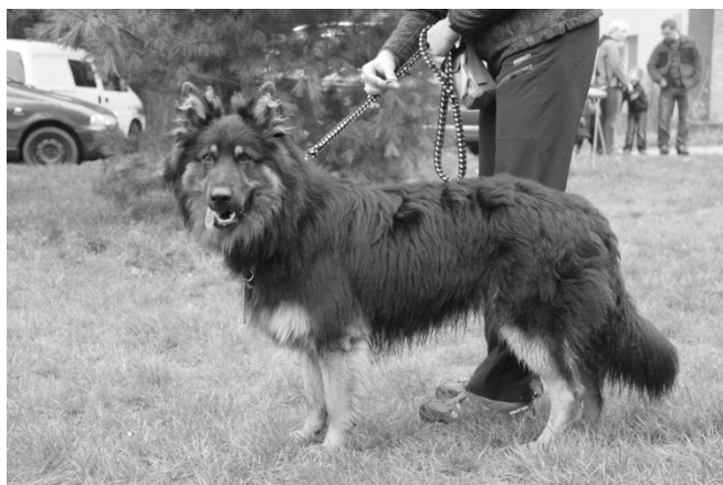
Huffy z Malého údolí