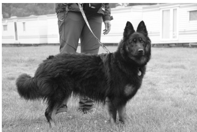
Berenica Dark Bark