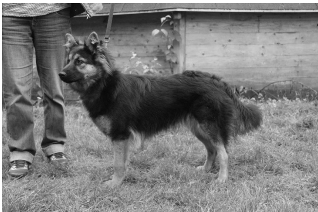
Camellia z Chrámeckých vinic

Háravé feny se mohou účastnit bonitace, nahlásí však tuto skutečnost u přejímky, fena zůstane mimo areál a nastupuje k posuzování jako poslední. Majitel souhlasí s uveřejněním fotografie svého psa/feny z této akce na stránkách klubu a v klubovém Zpravodaji.