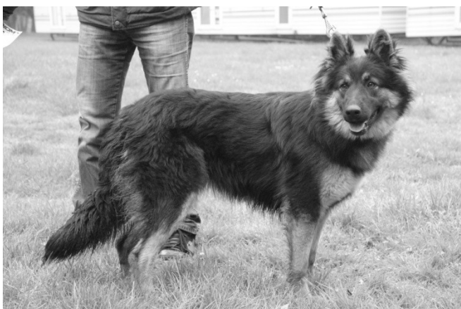
Arka z Hájenska