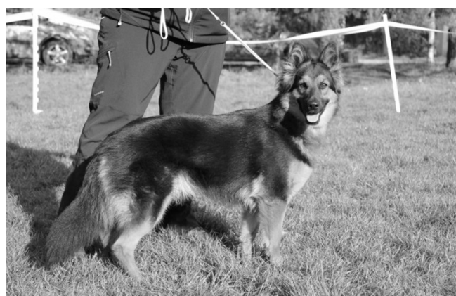
Feebee z Dašického zátíší