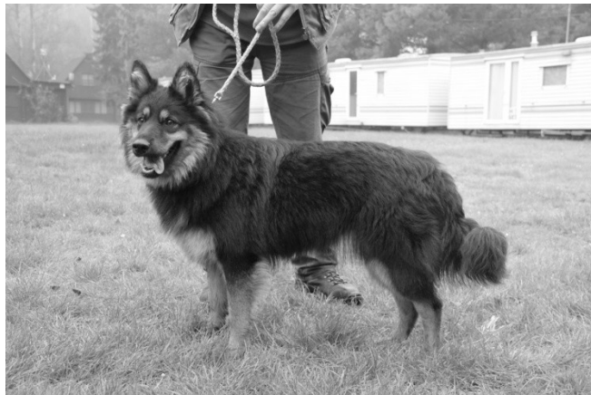
Adria pod Chlumem