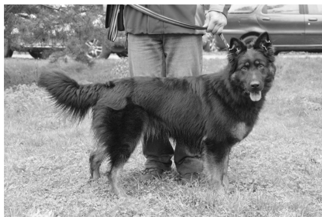
Ellis od Perlového potoka