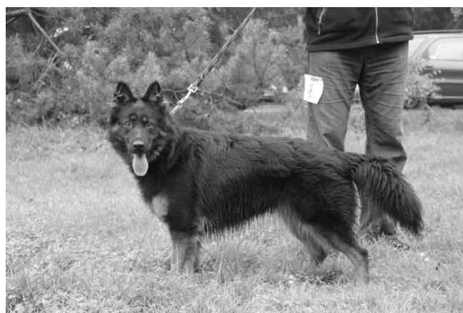
Enny od Perlového potoka