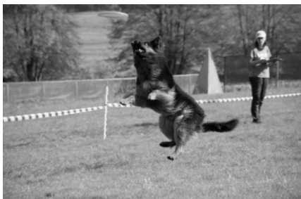
Pansey Bad z Dašického zátiší