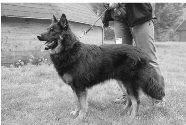
Athos z Hájenska