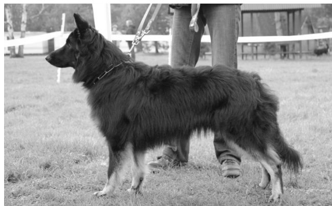
Cipisek z Volšinek