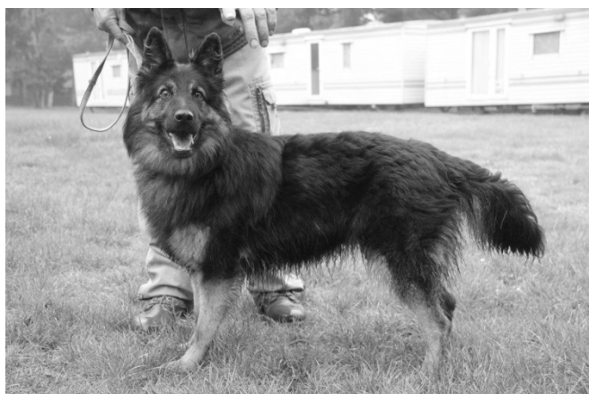
Bree Dark Bark