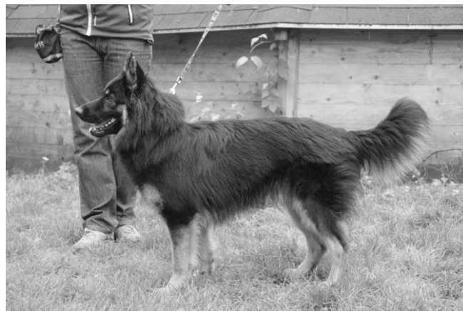
Crash z Chrámeckých vinic