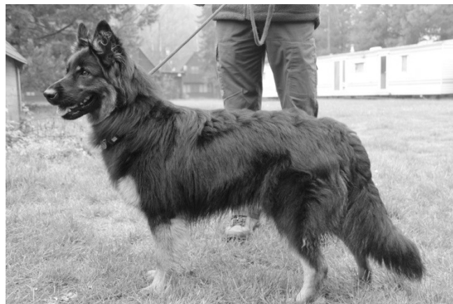
Greguska z Dašického zátiší