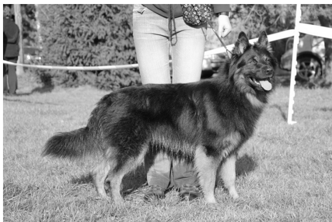
Cairo Xavi Chodák