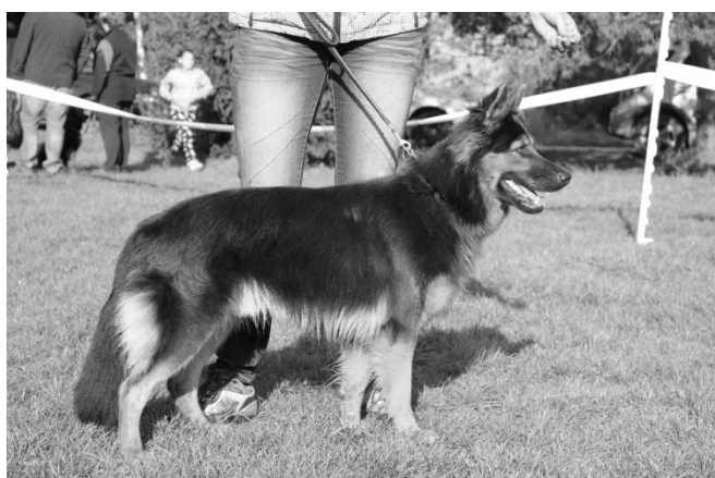
Cash Temný onyx