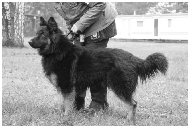
Bin Dark Bark