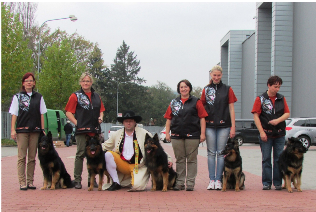
Akim z Čermenských lesů, Emet Lužanské hvězdy, Caezare Chucky od Malého Kosíře, Ariel od Sázavského splavu, Kesie z Dašického zátíší