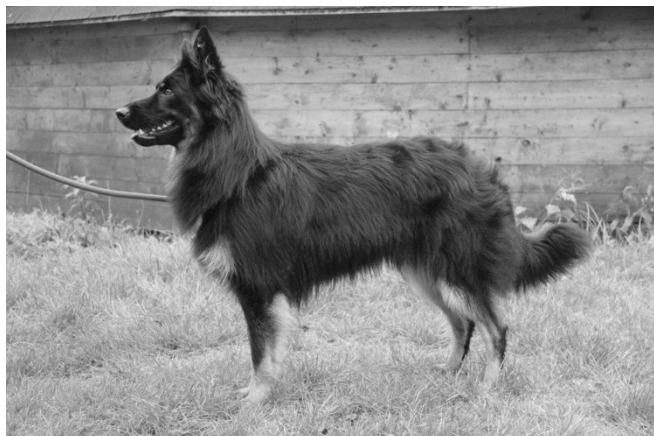
Gracie z Dašického zátiší

Kopii dokladu o platbě nalepte prosím na zadní stranu přihlášky.