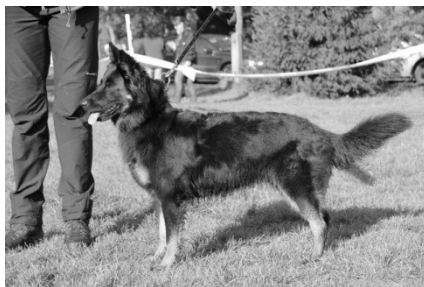
Taneila z Gipova