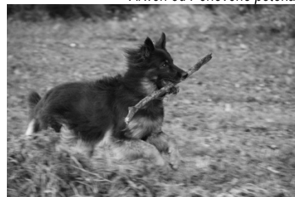
Arwen od Perlového potoka

Výše uvedené fotografie jsou ilustrační.