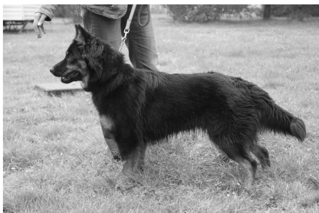
Chila z Boršova