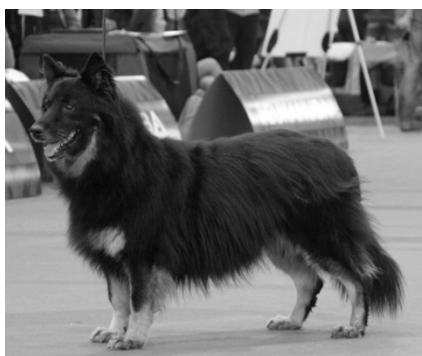
Cora Dolský mlýn V1, WE, BOV

Dostali jsme také prostor chodského psa představit a pohovořit o jeho vlastnostech a schopnostech na tiskové konferenci. A i tam jsme zaznamenali zájem o naše plemeno, což nás velmi potěšilo.