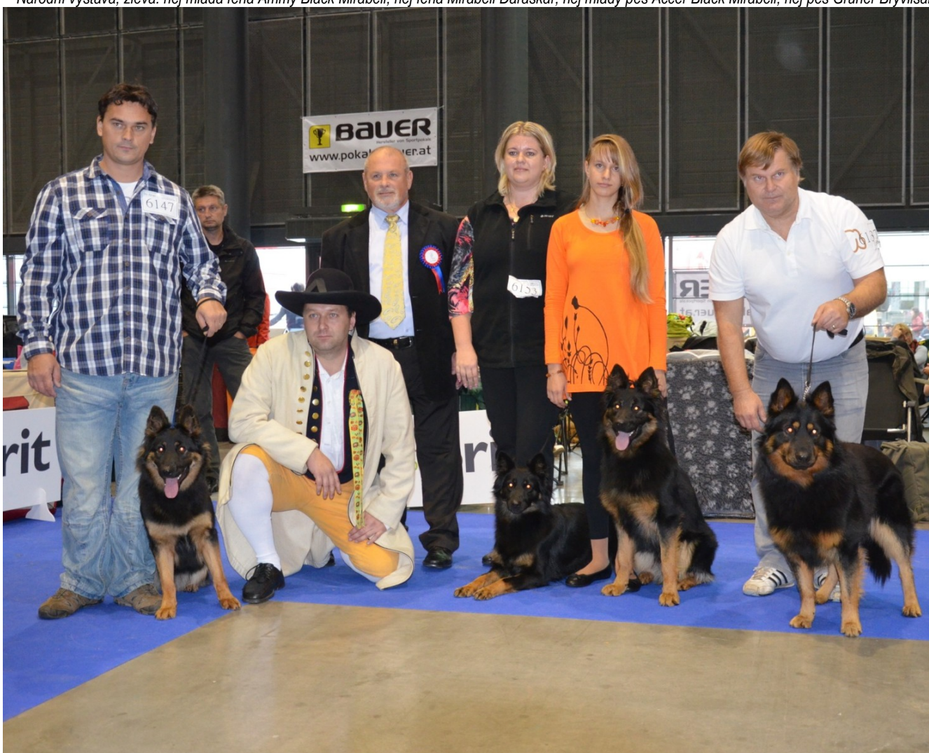
Národní výstava, zleva: nej mladá fena Ammy Black Mirabell, nej fena Mirabell Daraskár, nej mladý pes Accer Black Mirabell, nej pes Grüner Bryvilsár