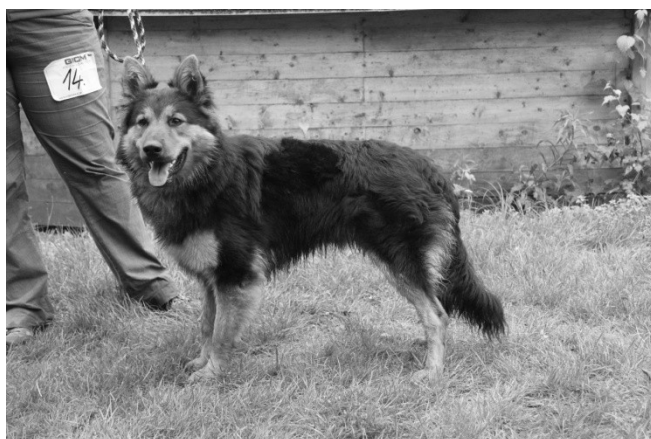
Arco pod Chlumem