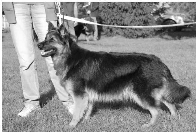
Betsy od Roveňské hranice