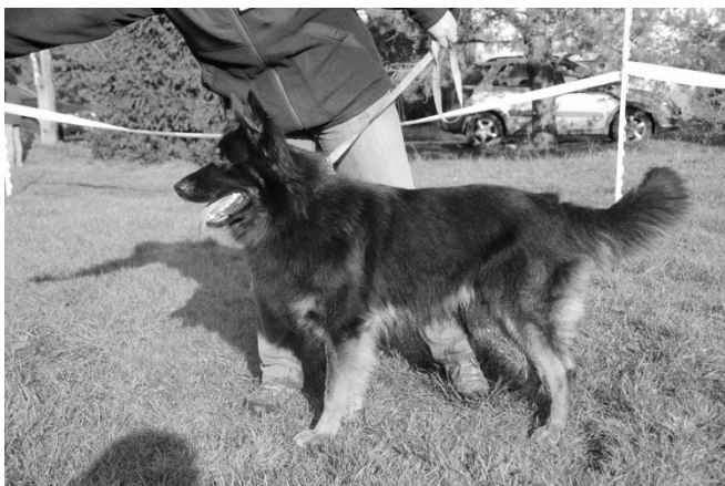
Argo od Sázavského splavu