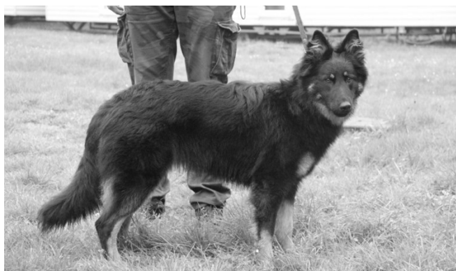
Besi z Příborského dvora