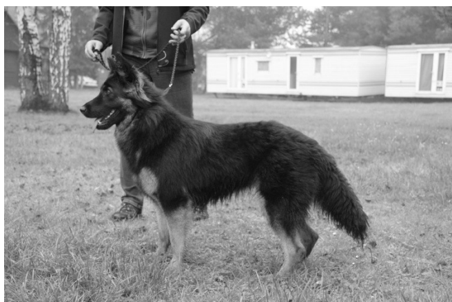
Bea Dark Bark