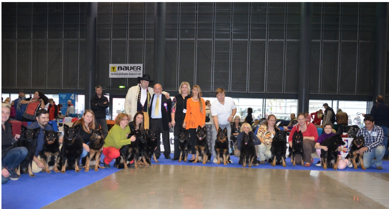
Účastníci Národní výstavy v Brně