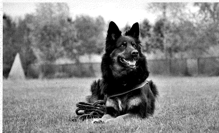
Flora z Boršova