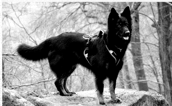
Filli Magic Inferno