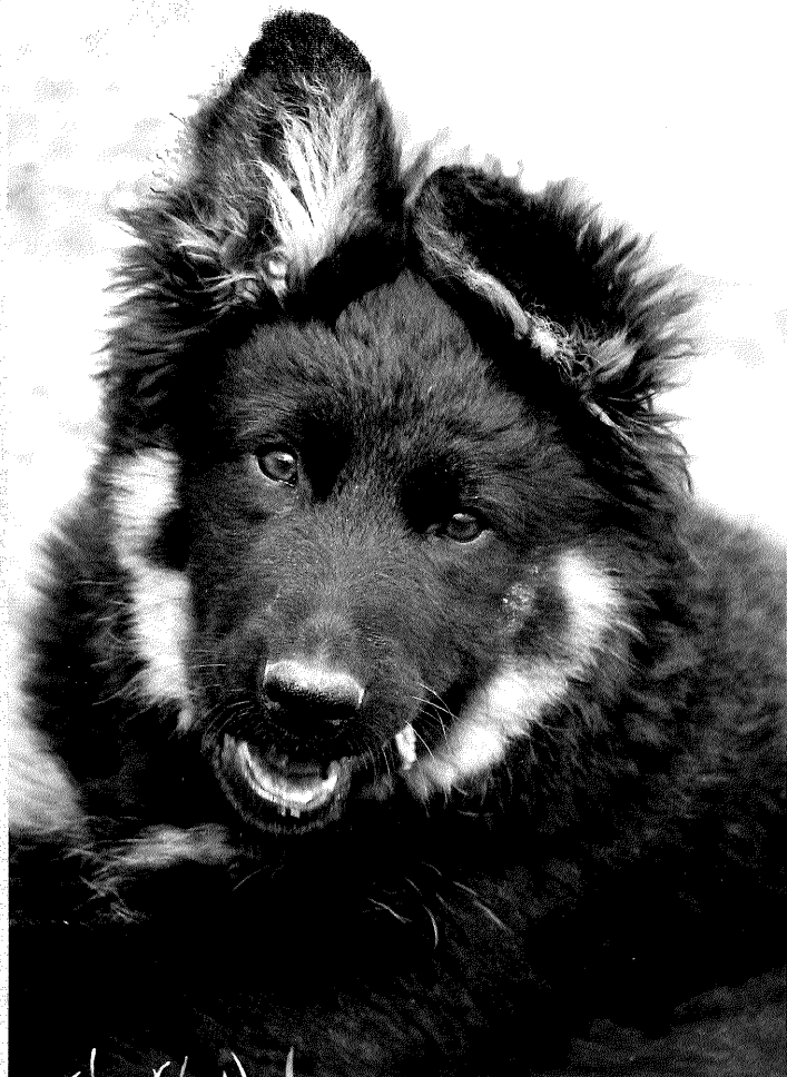
Dea Dorothea Fidelis et Fortis