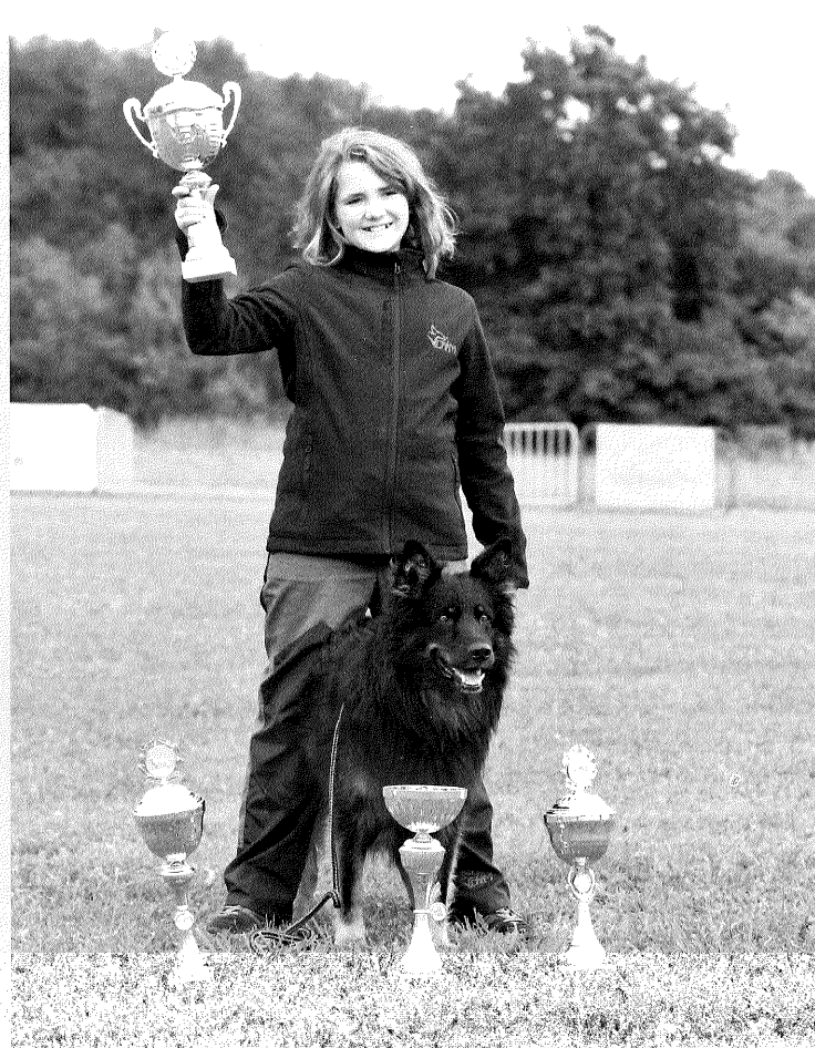
Ozzy z Dašického zátiší