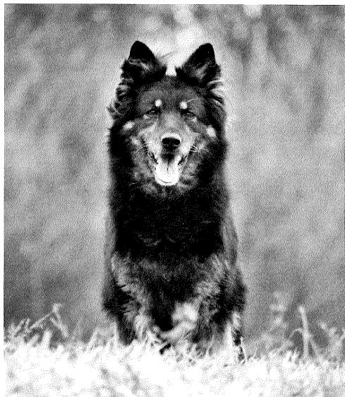
Amy Černá luna