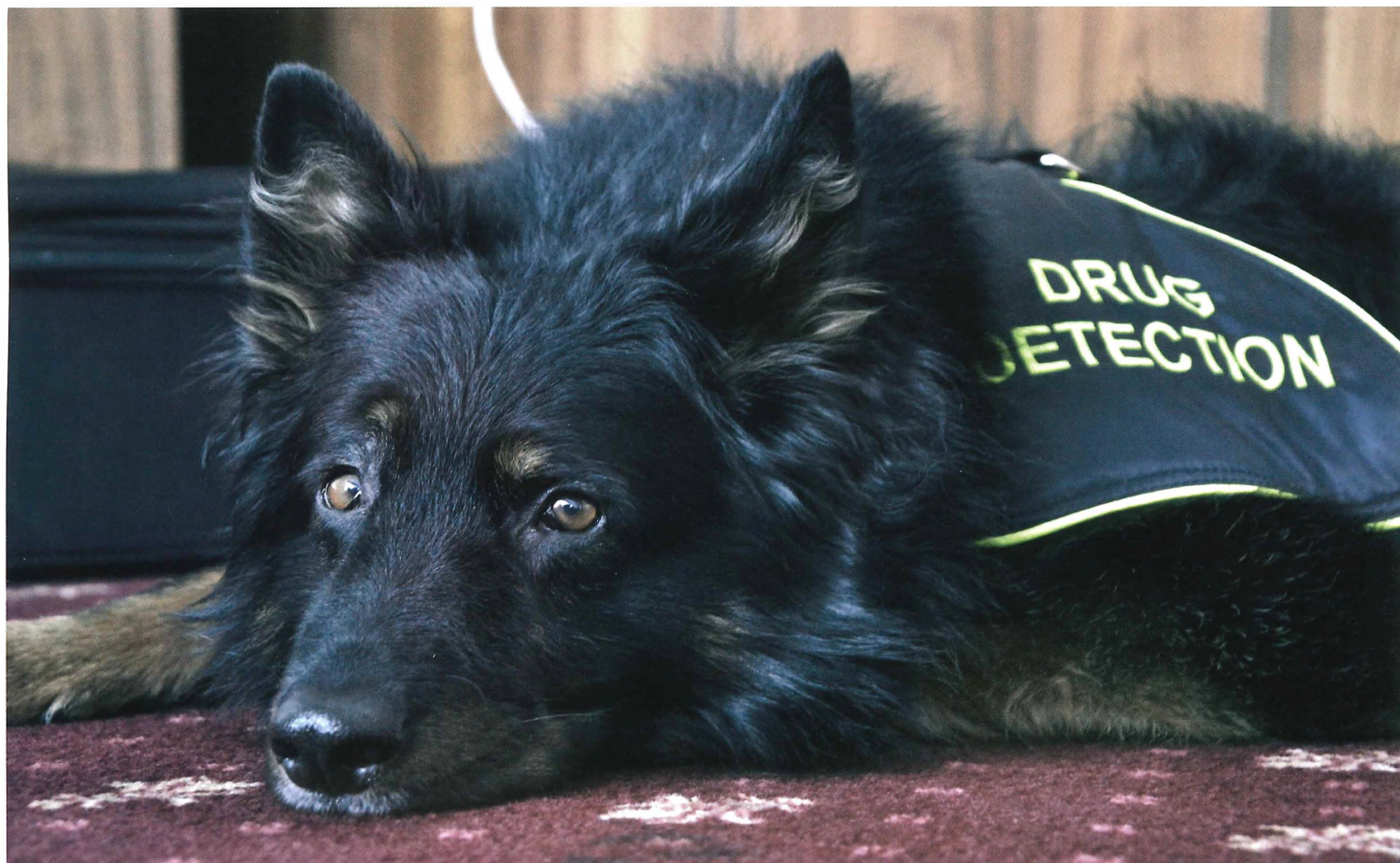
Ozzy z Dašického zátiší