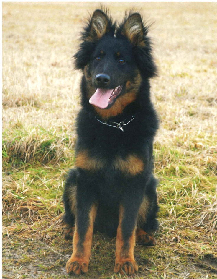
Dangerous Black Monster