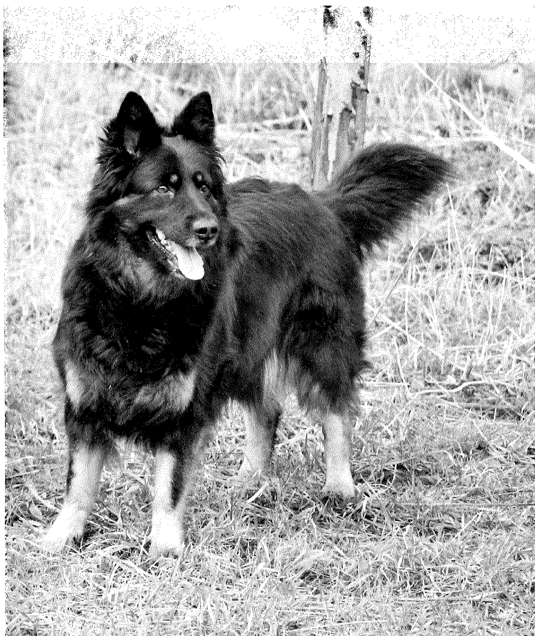
Ágnes od Minurky

Arlin nejen, že výborně tančí, chytá frisbee a skáče přes agility překážky. Jde jí i sportovní kynologie. Na konci listopadu loňského roku složila zkoušku StPr 3. Tedy speciální zkoušku, kde na ploše 50 x 30 metrů pes hledá pět cizích předmětů, každý o rozměru 5 x 3 x 1 cm. Arlin to při zkoušce neměla vůbec jednoduché. Vál silný vítr a byla velká zima. Přesto se hezky snažila a všechny předměty našla.