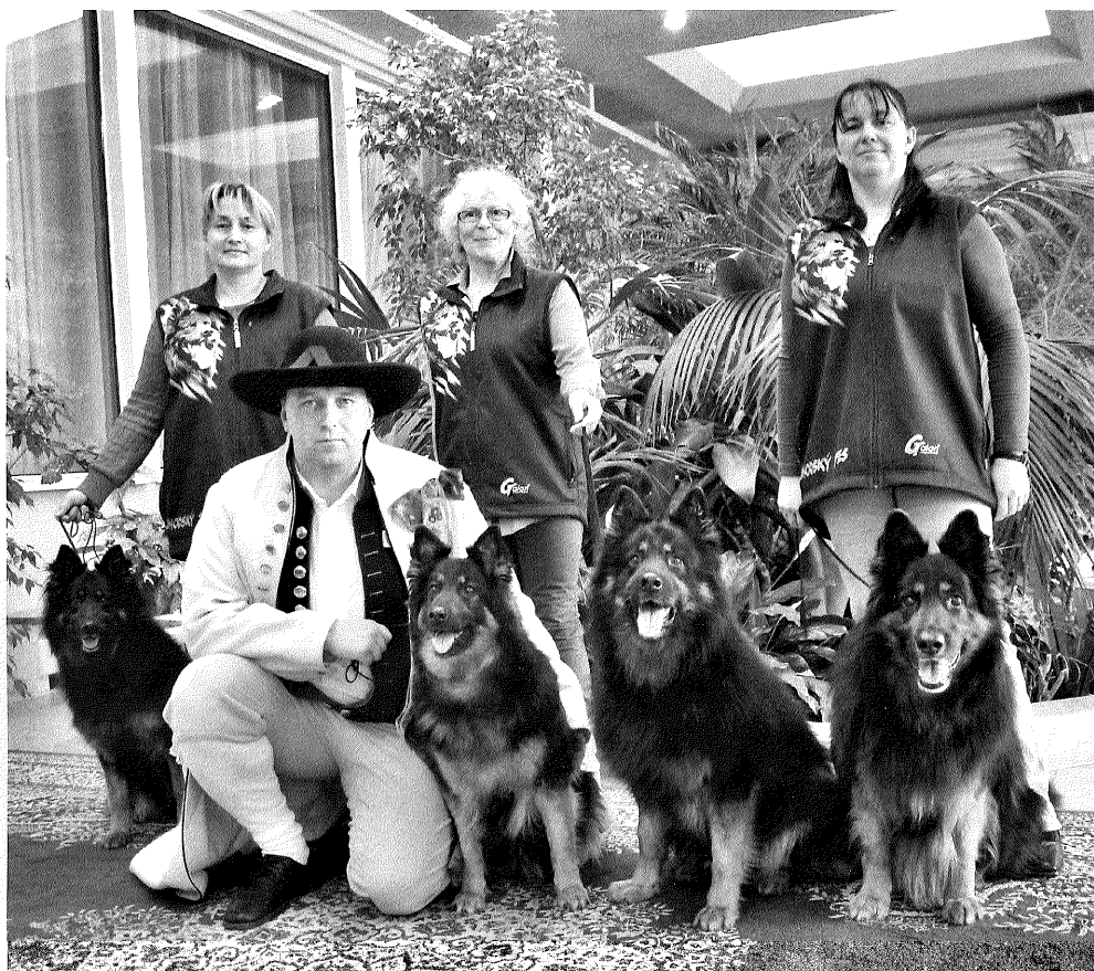
Princess z Gipova, Orchidea Lukato Gold, Ortis Vigilo a Maxwell Lukato Gold