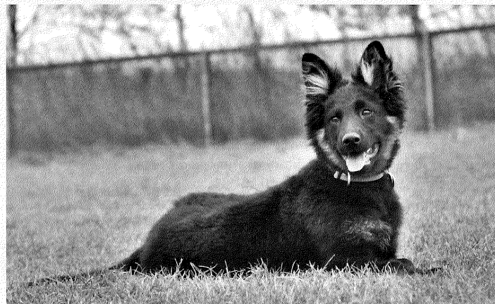
Alf z Řepínského dolu