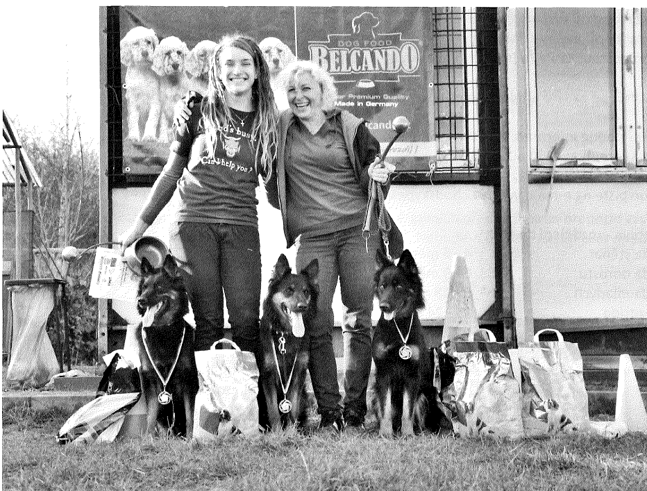
Stříbrná Penelope Mag z Gipova, zlatá Aranell Bozdrs Voronda Nildo a bronzová Izabell z Letinské kovárny