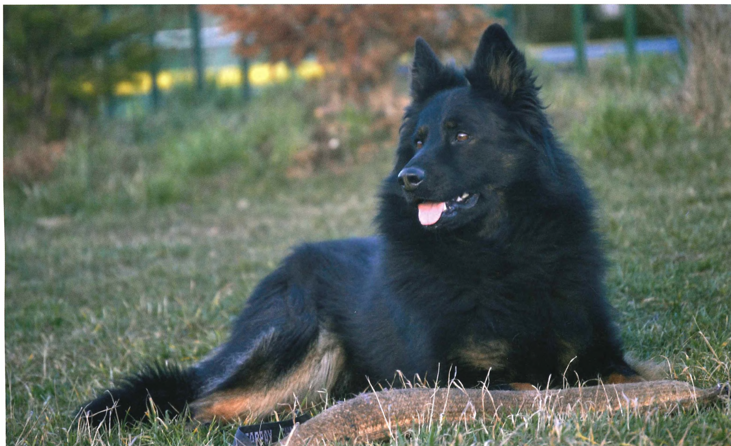
Unicas z Gipova