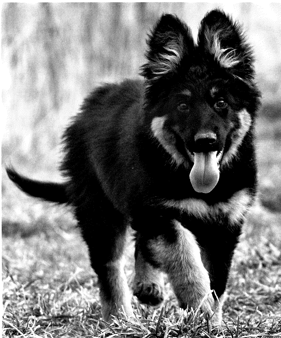
Axel z předhůří Chřibů

Nové majitele štěňat informujte o existenci Klubu přátel chodského psa (KPCHP), předejte jim Žádost o přijetí za člena nebo pošlete link, kde tuto žádost na klubovém webu najdete. Případně jim sdělte adresu jednatele klubu.