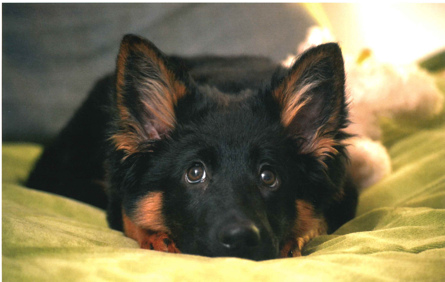
titulní strana: Bennet Temný onyx