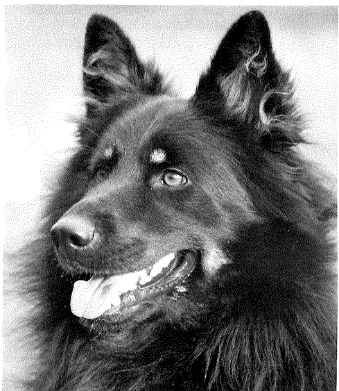
Balů z Chrámecký vinic