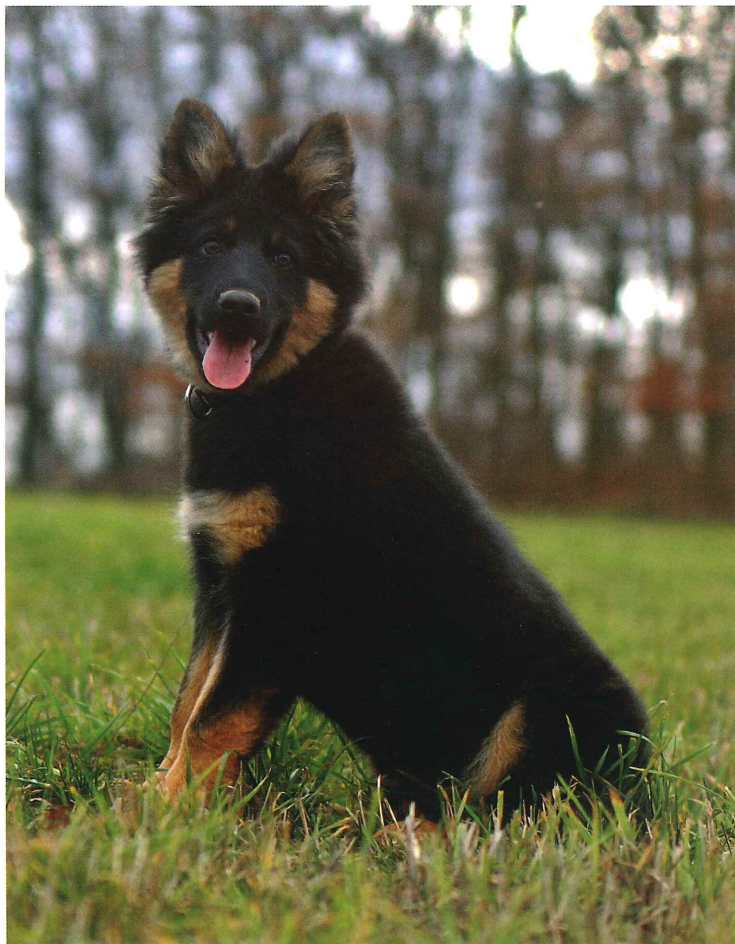
Caesar Chodský drahokam