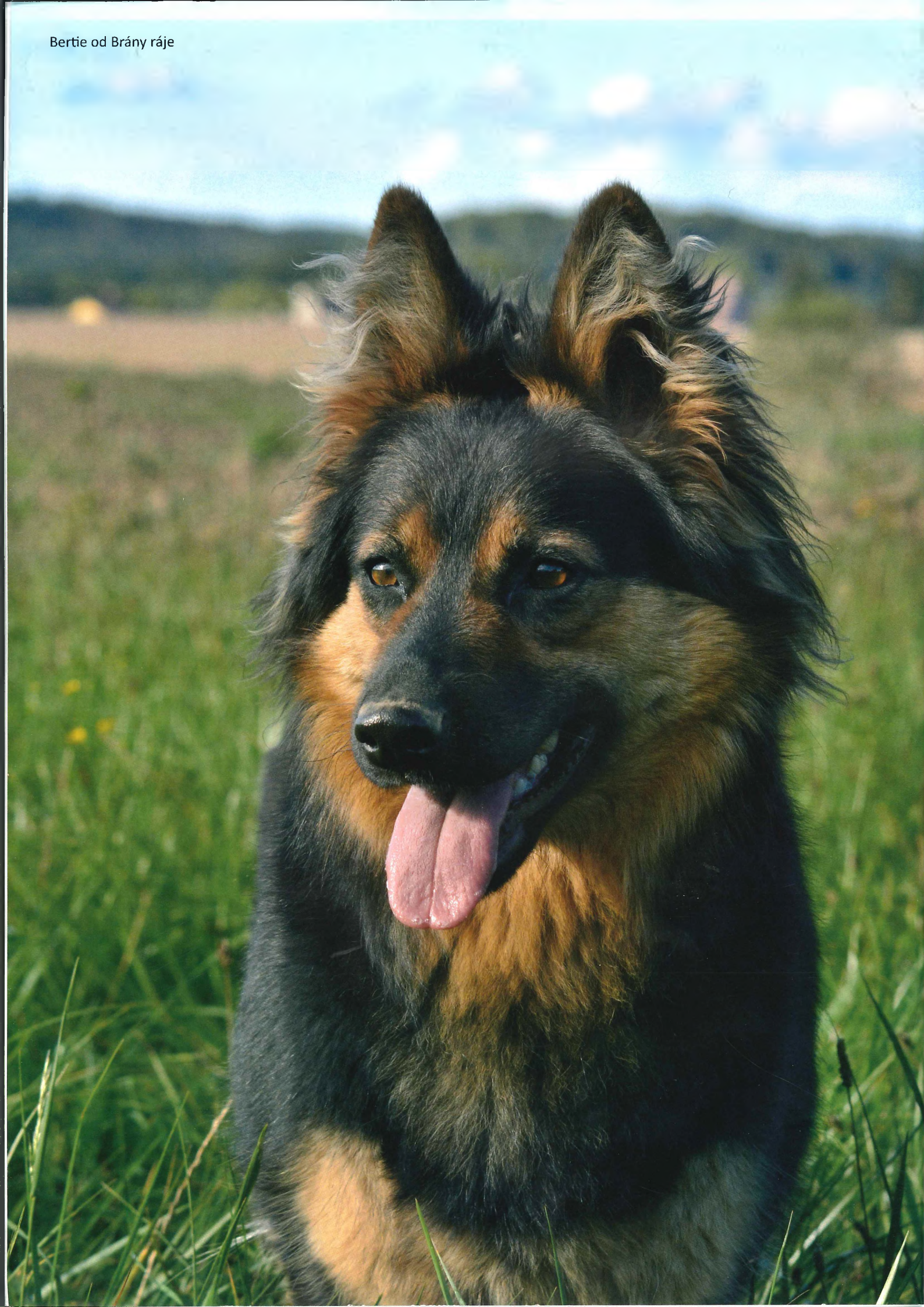
Bertie od Brány ráje